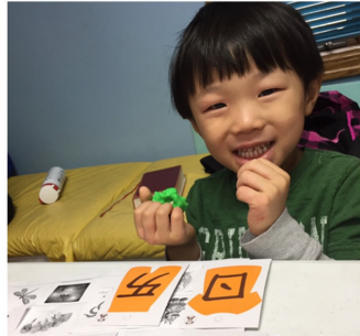
喜樂中文學校幼幼班-注音抓抓樂