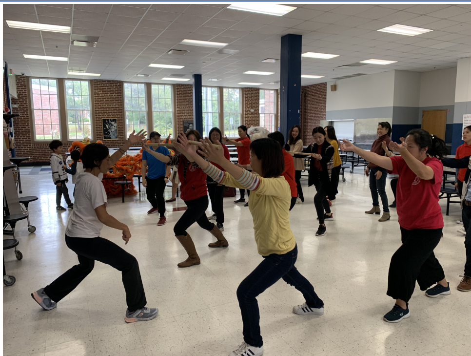
拿獅頭的姿勢，重心需在前腳