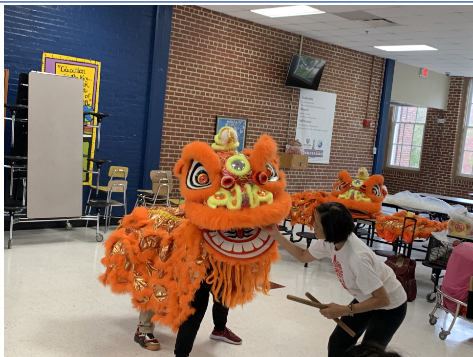
如何讓獅口張合動作