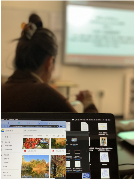
2019克里夫蘭數位教學示範點教師培訓—iMovie功能簡介以及如和利用Apple電腦或平板電腦來製作與剪輯影片以輔助華語文數位教學3