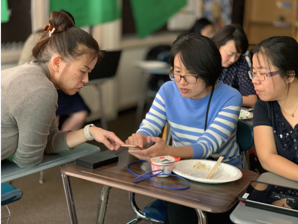
2019克里夫蘭數位教學示範點教師培訓—iMovie功能簡介以及如和利用Apple電腦或平板電腦來製作與剪輯影片以輔助華語文數位教學2