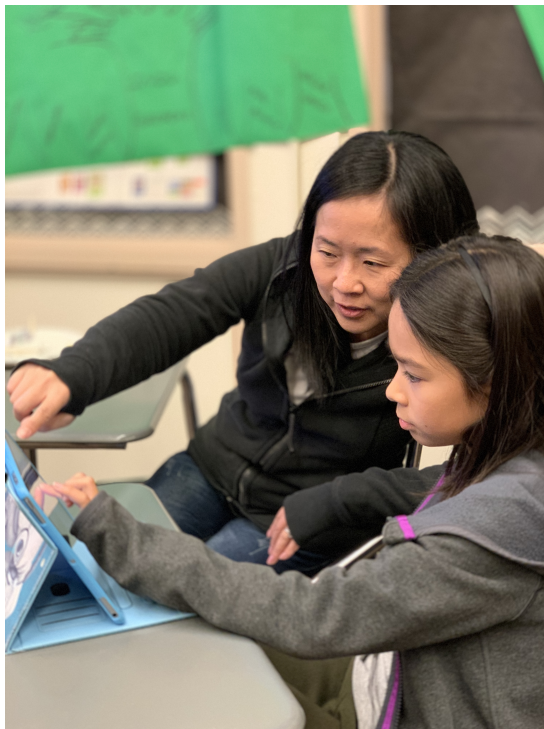
2019克里夫蘭數位教學示範點教師培訓—iMovie功能簡介以及如和利用Apple電腦或平板電腦來製作與剪輯影片以輔助華語文數位教學1

參與培訓的老師們，在影音多媒體製作方面，除了之前學過的Movie Maker及Story Remix之外，現在又多了一項新的選擇 - iMovie。