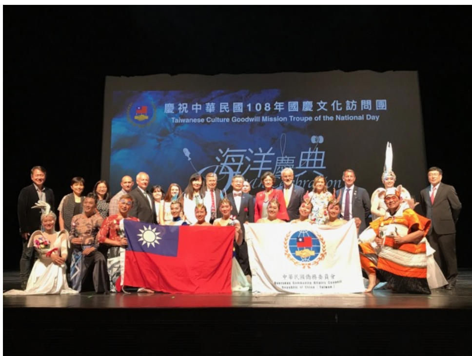
國慶文化訪問團全體演員與貴賓合影