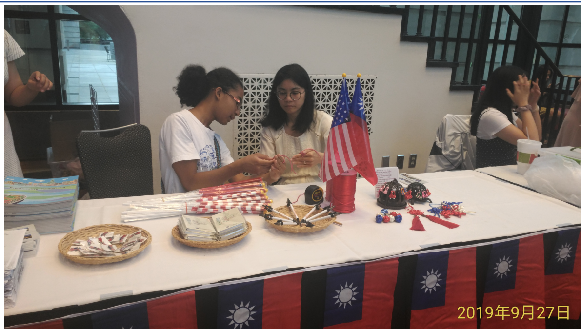
現場指導中國結製作