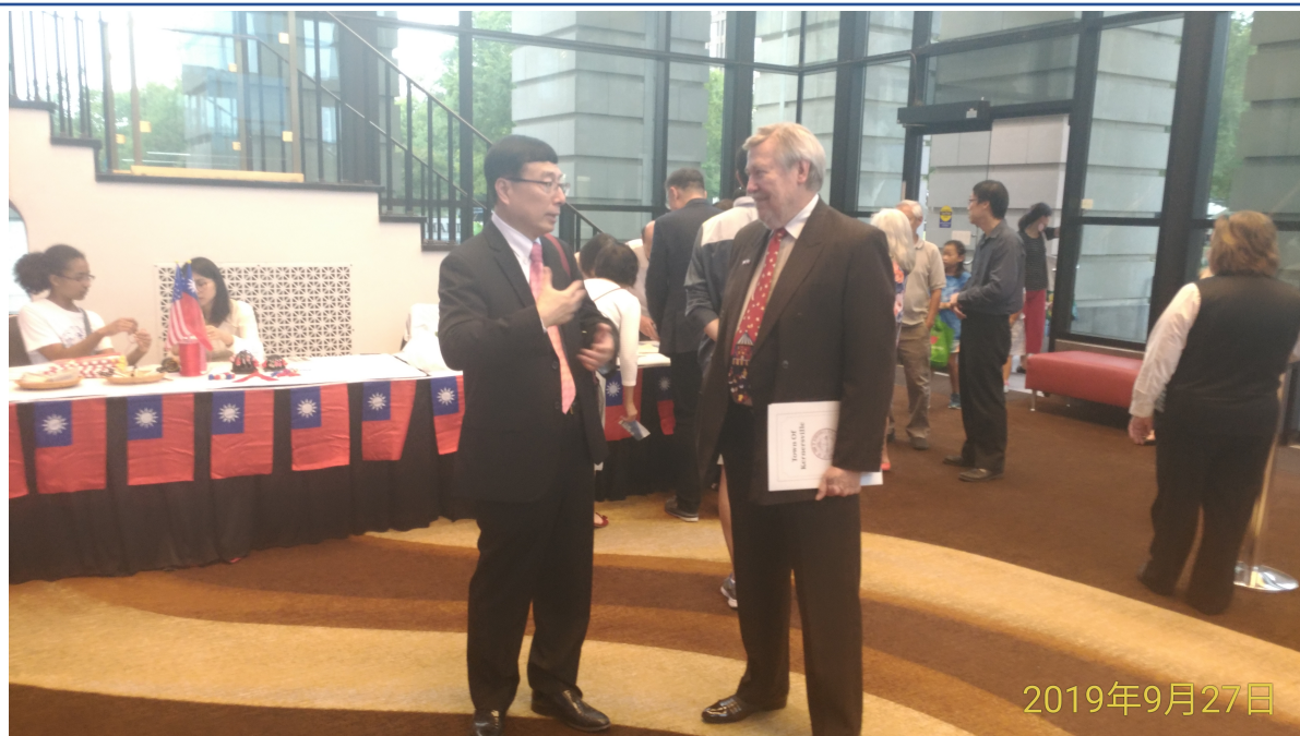
臺藝會會長與主流人士