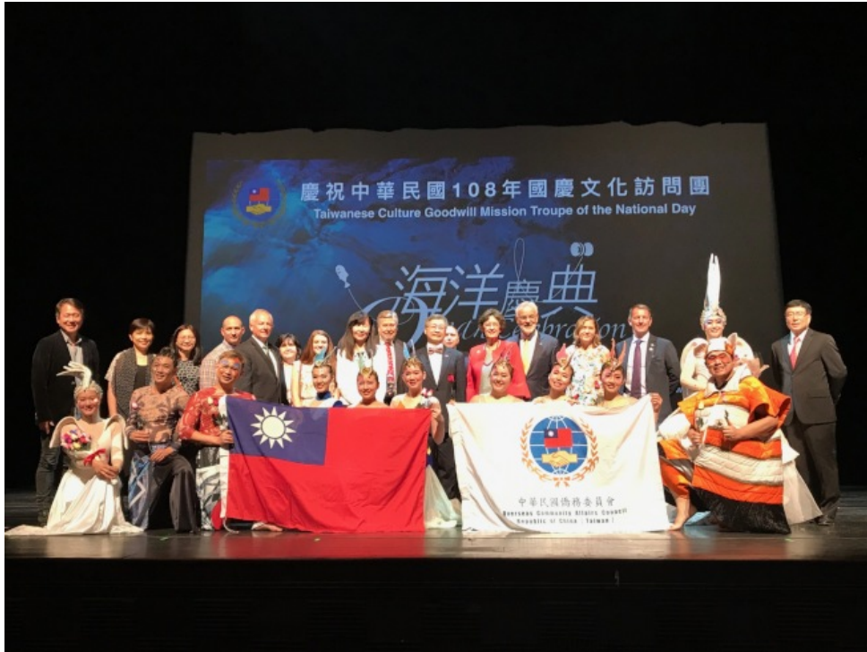
國慶文化訪問團全體演員與貴賓合影