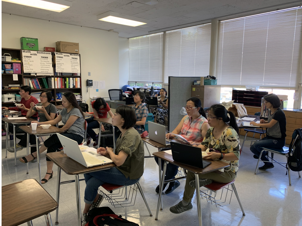
克里夫蘭數位教學示範點教師培訓—Powtoon卡通動畫製作在正體字推廣與華語文數位教學的設計與應用4