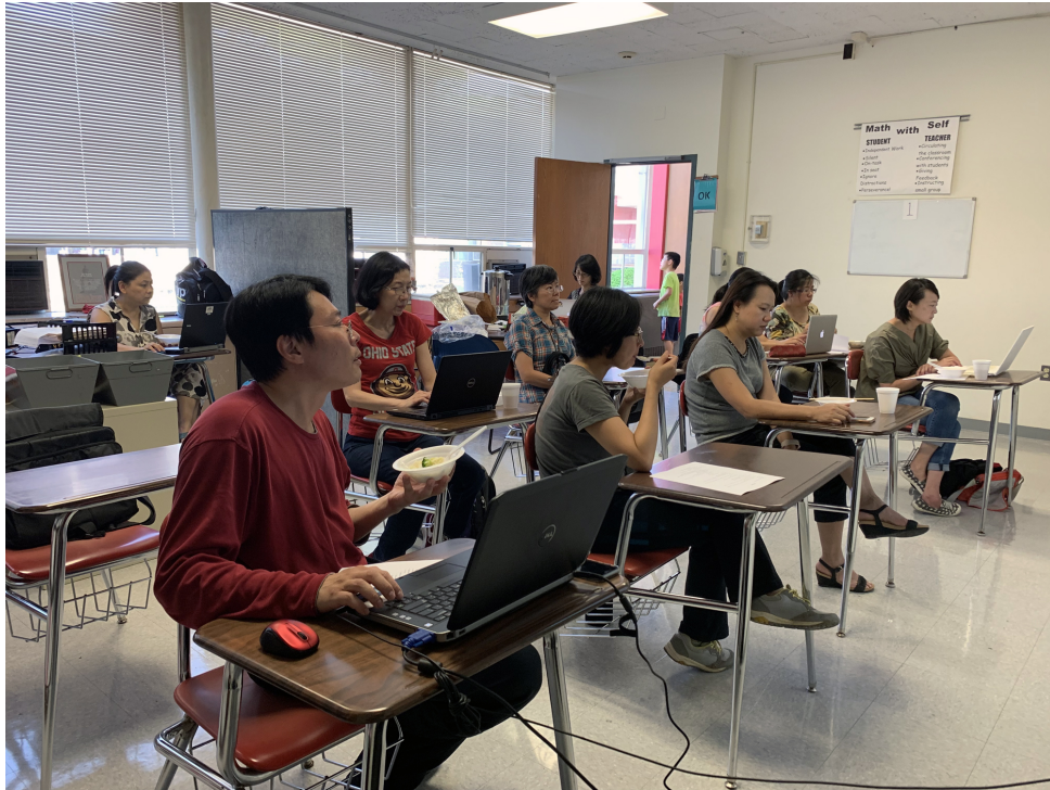
克里夫蘭數位教學示範點教師培訓—Powtoon卡通動畫製作在正體字推廣與華語文數位教學的設計與應用3