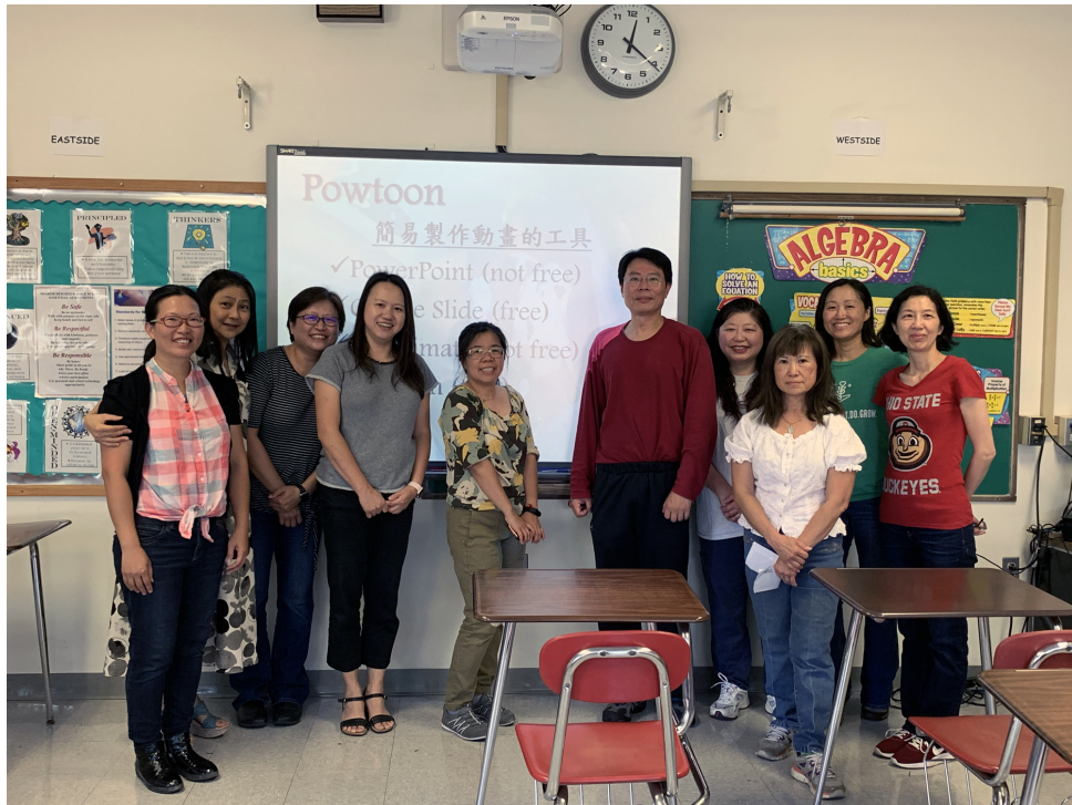
克里夫蘭數位教學示範點教師培訓—Powtoon卡通動畫製作在正體字推廣與華語文數位教學的設計與應用1