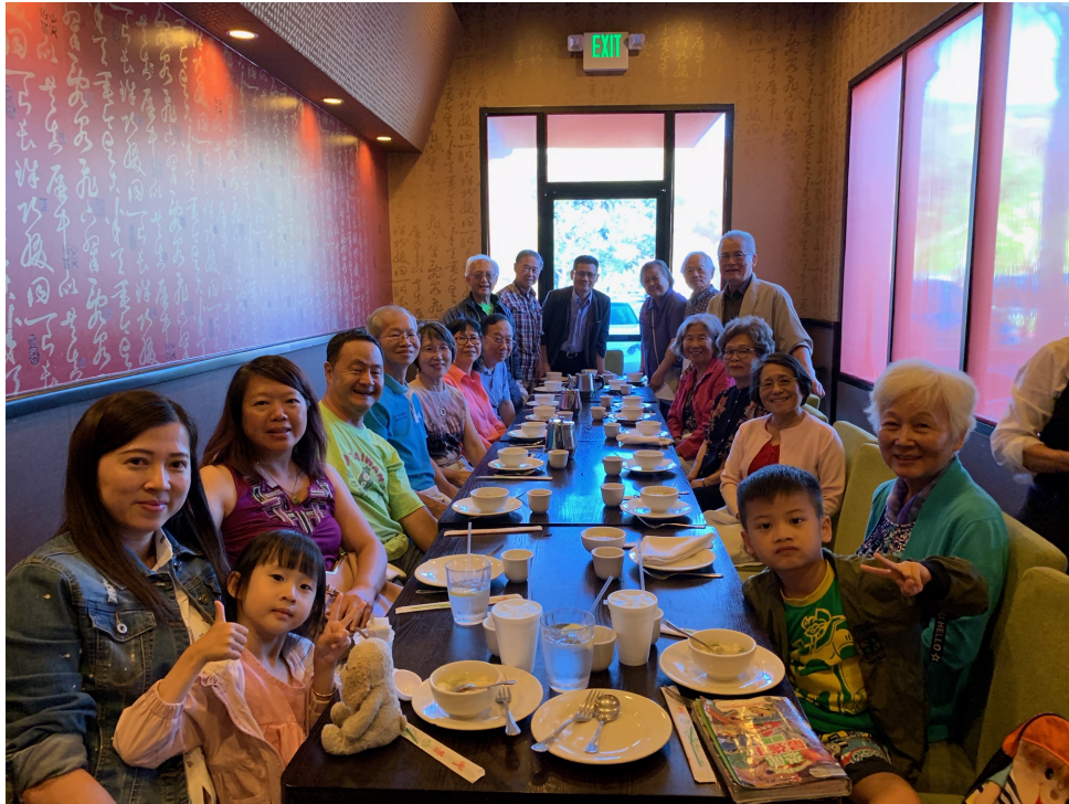
中華民國僑務委員會贊助之2019年北美台語教師研習營-洛杉磯區1