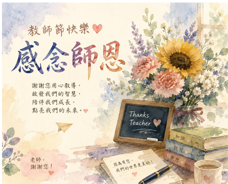
114年海外僑民學校教師獎勵