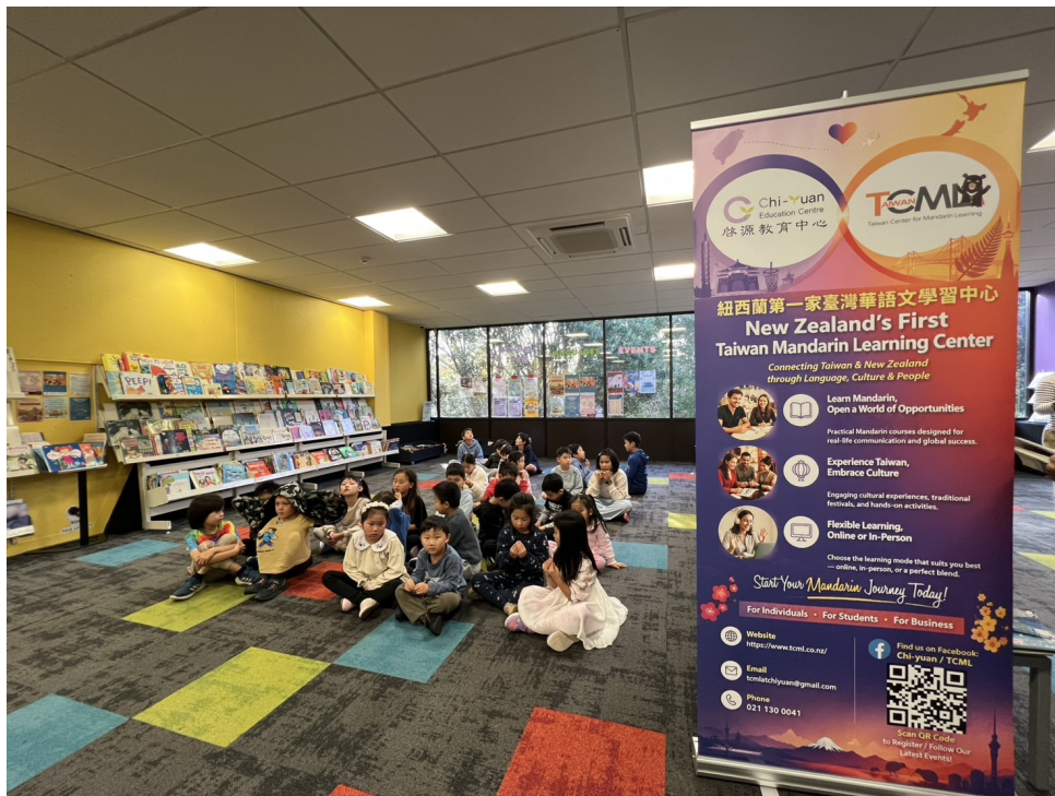
等待表演的孩子們

為提升參與樂趣，啟源教育中心特別準備富有臺灣特色的闖關獎品，除了實用文具外，更精心挑選印有「臺灣」字樣及臺灣特色元素的小禮物。許多完成闖關的民眾收到獎品時都驚喜不已，不僅留下美好的活動回憶，也對臺灣文化產生更深刻的印象。