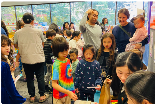
闖關後大家開開心心換禮物（上）非常開心拿到介紹臺灣的桌曆（下）