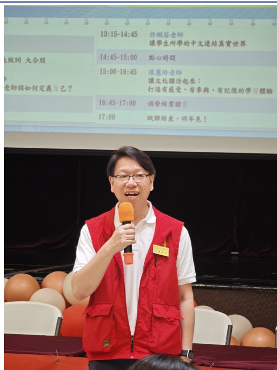
傅其俊會長歡迎和感謝參與的老師和校長理事們