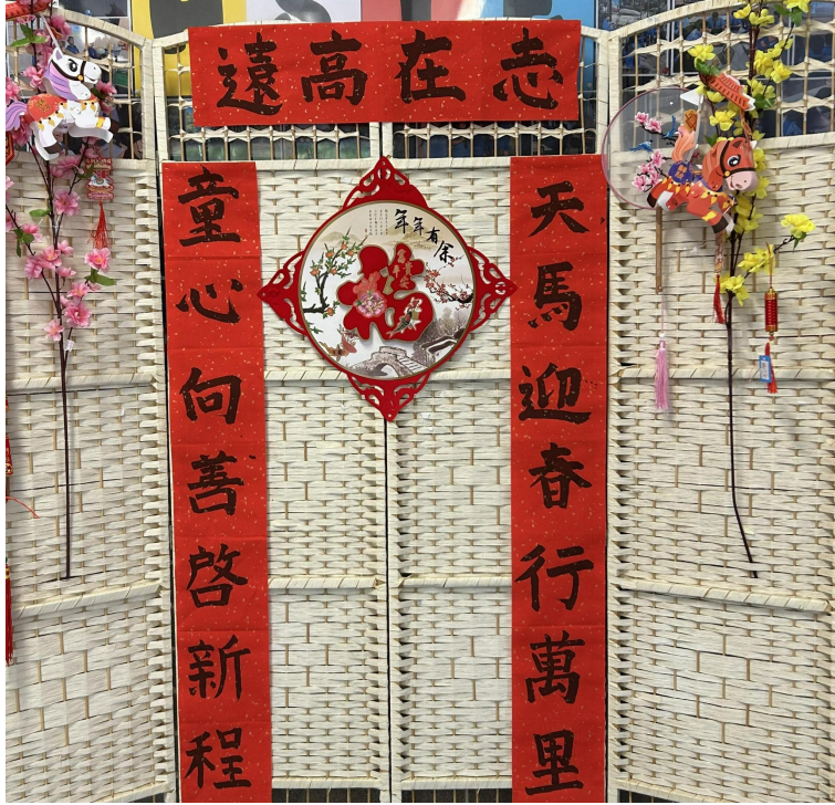
送給孩子們最好的新年禮物——春聯