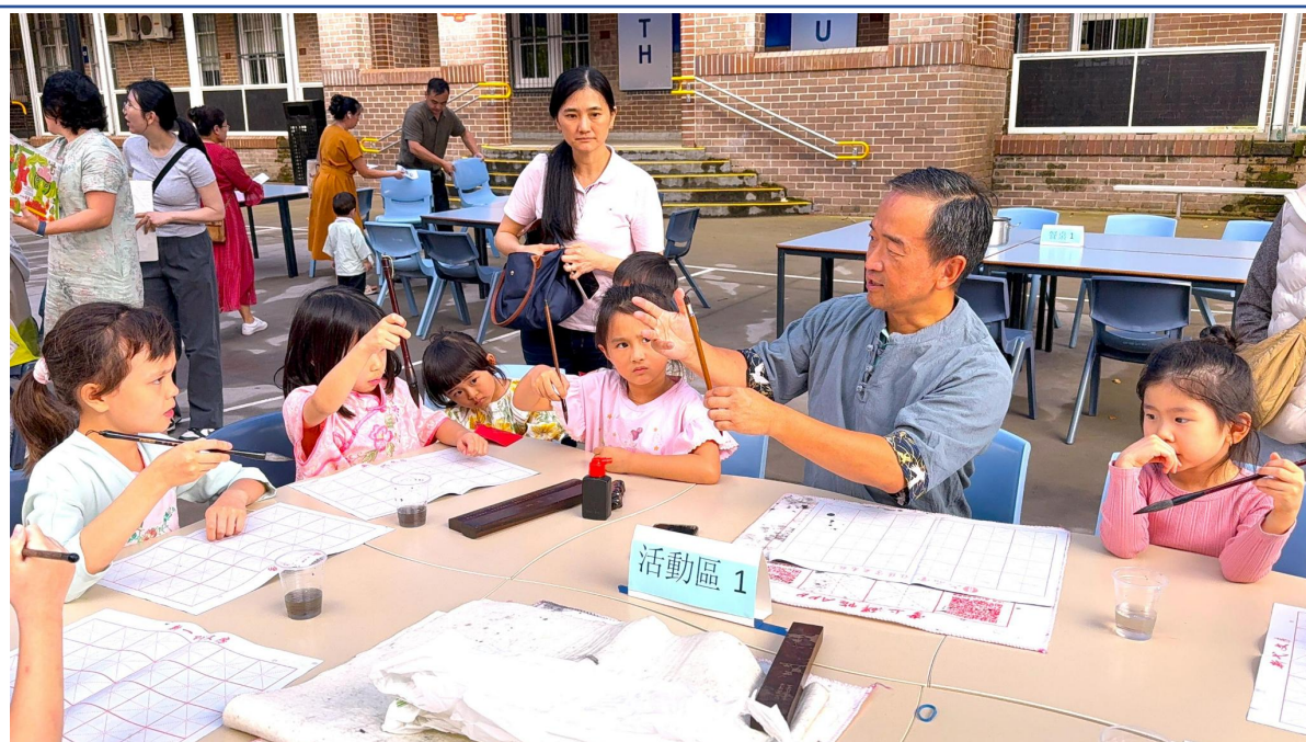
現場學書法，寫吉言，饒有興致