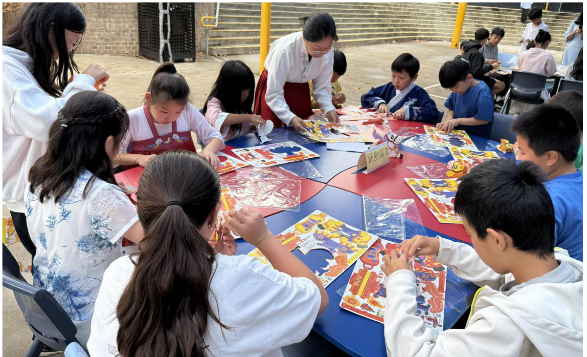
孩子們在製作僑委會提供的小馬燈手工

活動亦設「新年的真相」講解，引導孩子分辨傳統稱謂與節日淵源，深化對中華正統文化的本源了解。壓軸分區體驗活動包括書寫吉語、觀摩春聯、馬年手工及投壺等傳統遊戲，並品嚐餃子、年糕等節令食品。