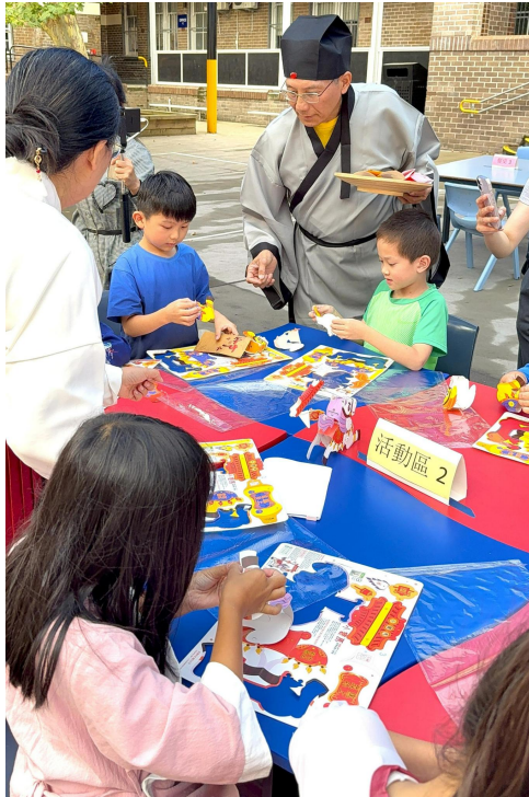
著古裝的校長送糖果來了