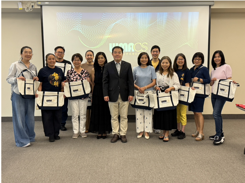
參與計畫的華府地區中文學校