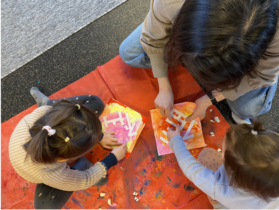
幼兒製作自己的春聯