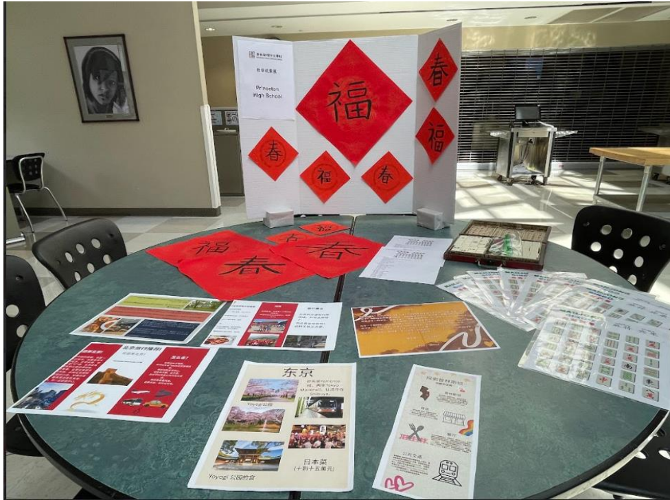
Princeton High School展示春聯作品、旅遊作業、麻將教具