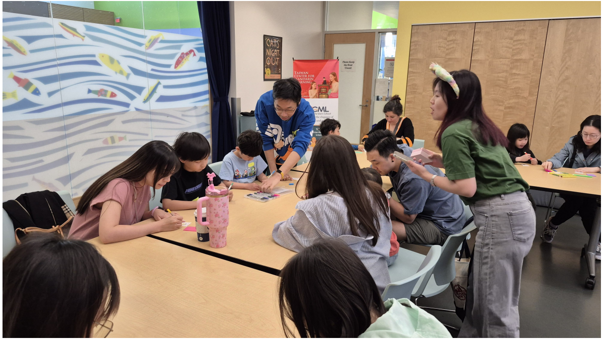
CML親子班文化創意手作景況之一