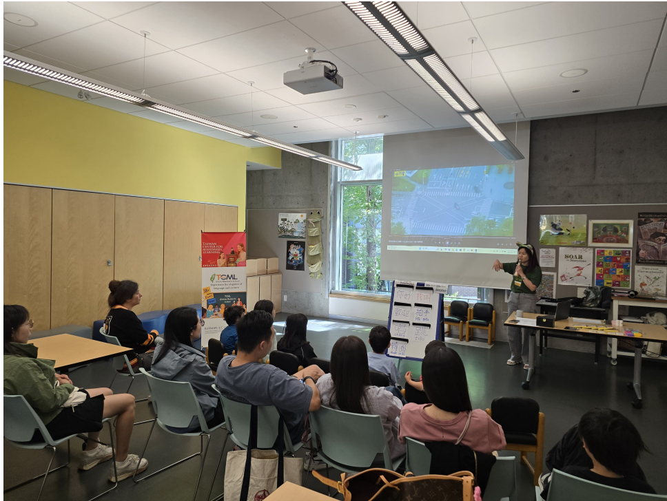
CML親子班上課景況之二