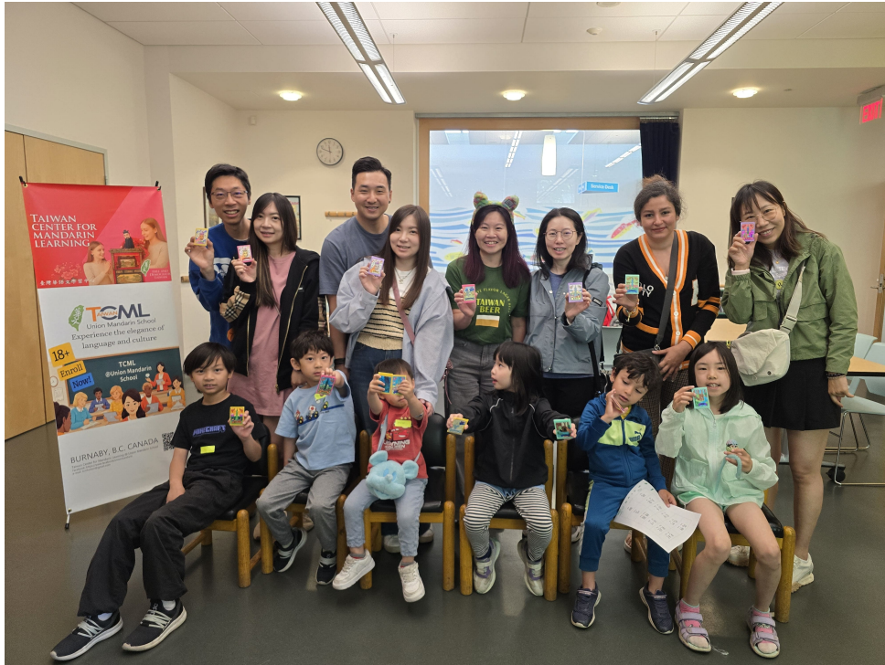
親子班學員們開心完成第一堂課