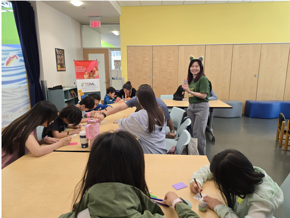
TCML親子班文化創意手作景況之二