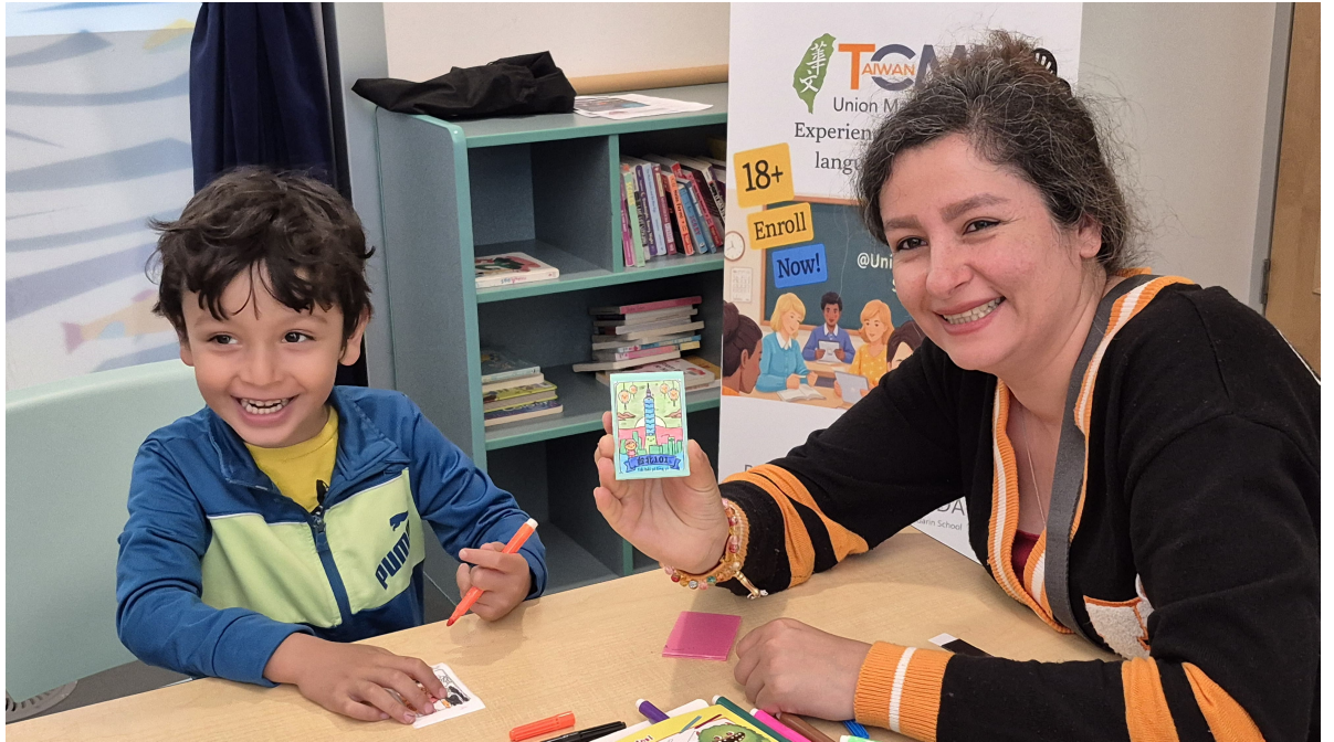
親子協力完成，展示作品