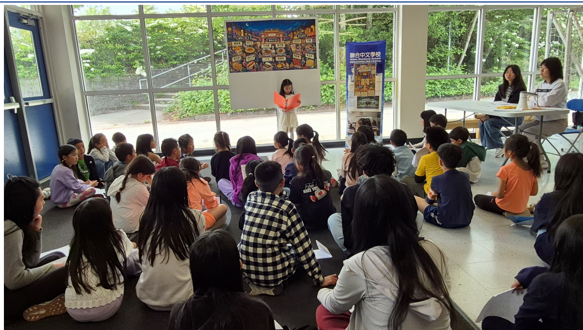
「漢字說故事，用聲音走進臺灣夜市」決賽景況一