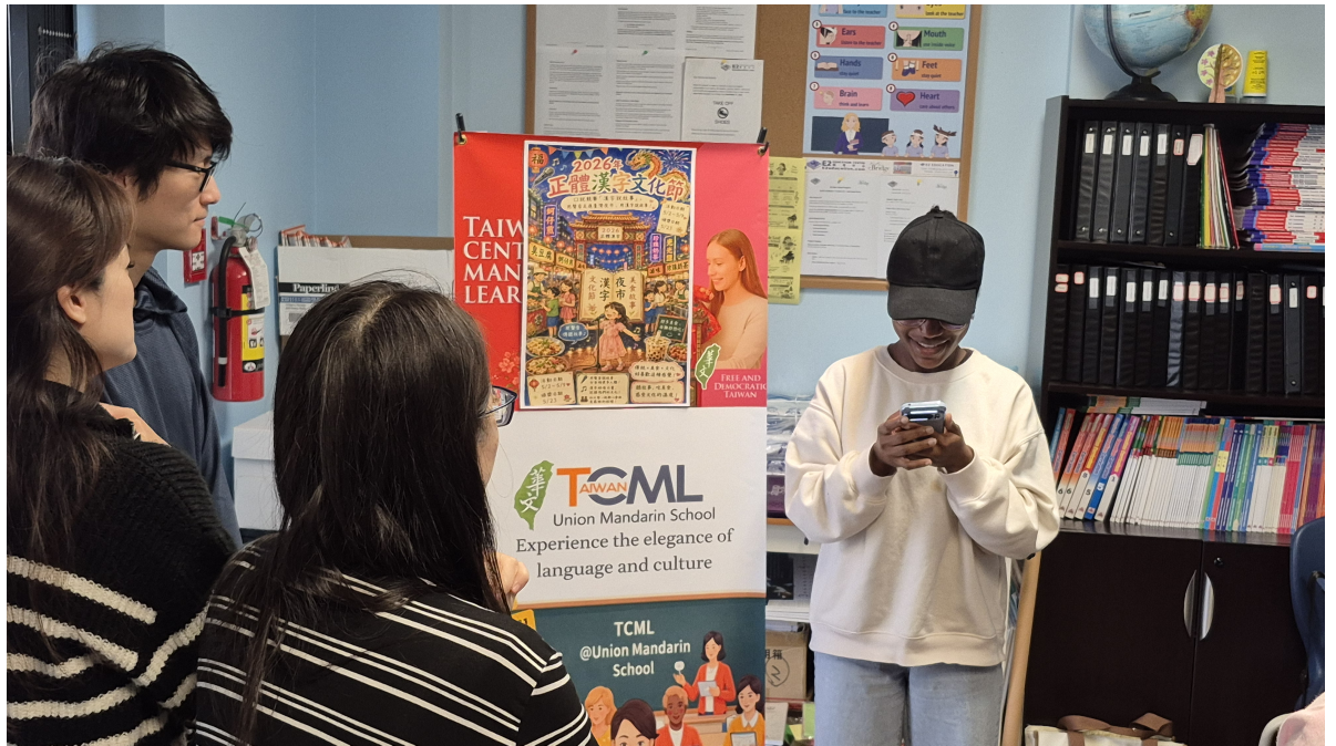
「漢字說故事，用聲音走進臺灣夜市」TCML成人組決賽景況二