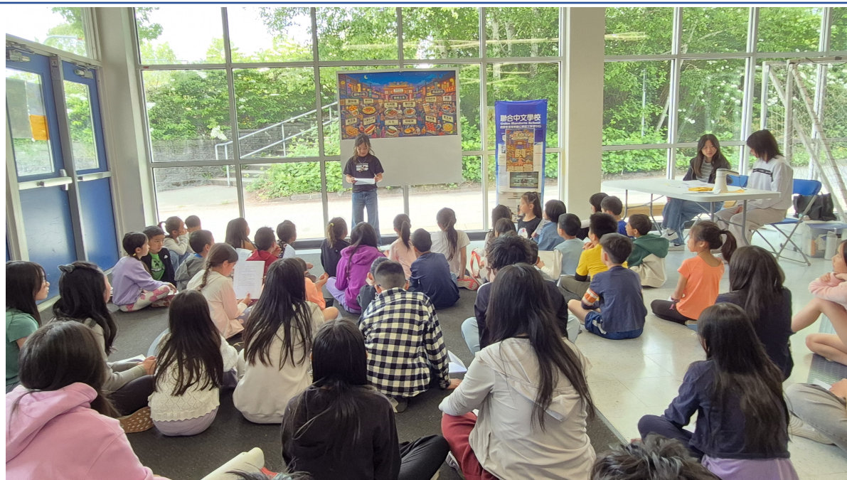
「漢字說故事，用聲音走進臺灣夜市」決賽景況二