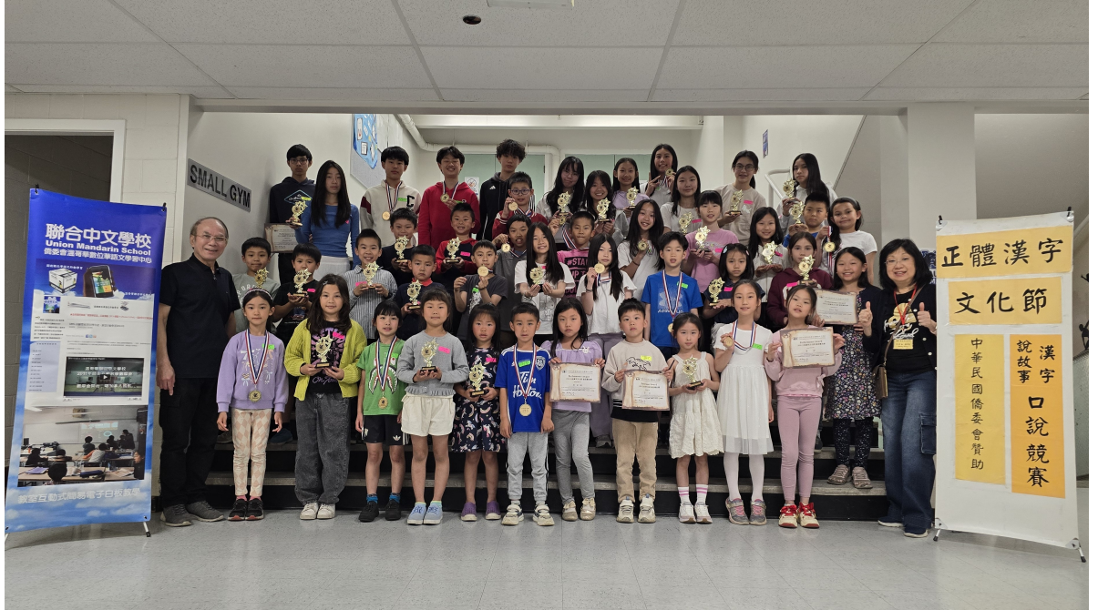
獲獎全體同學合影