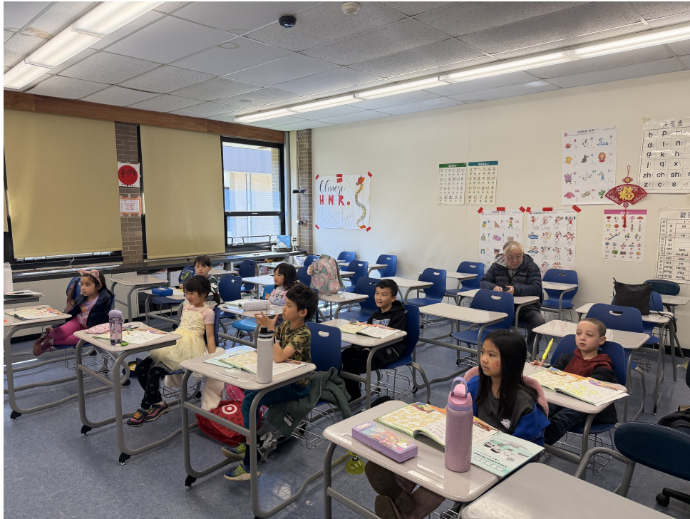
新海中文學校舉行華語歌曲教唱活動