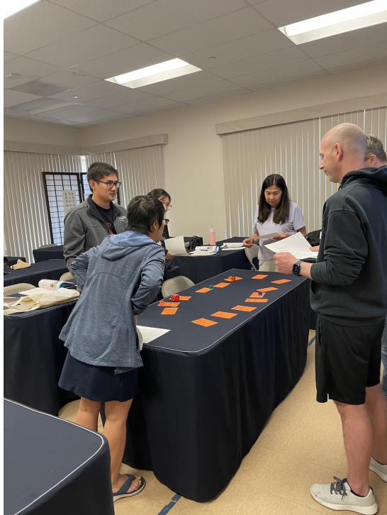
口說練習與情境模擬