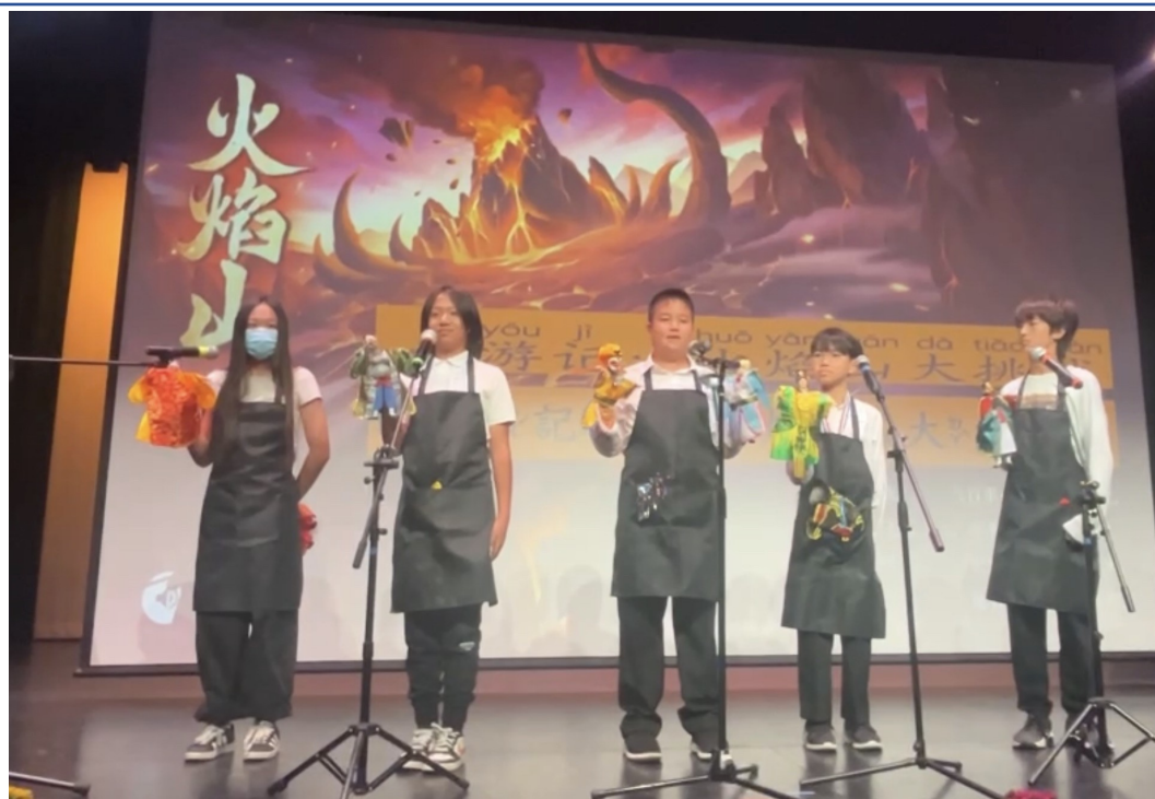
中文六班表演布袋戲-西遊記