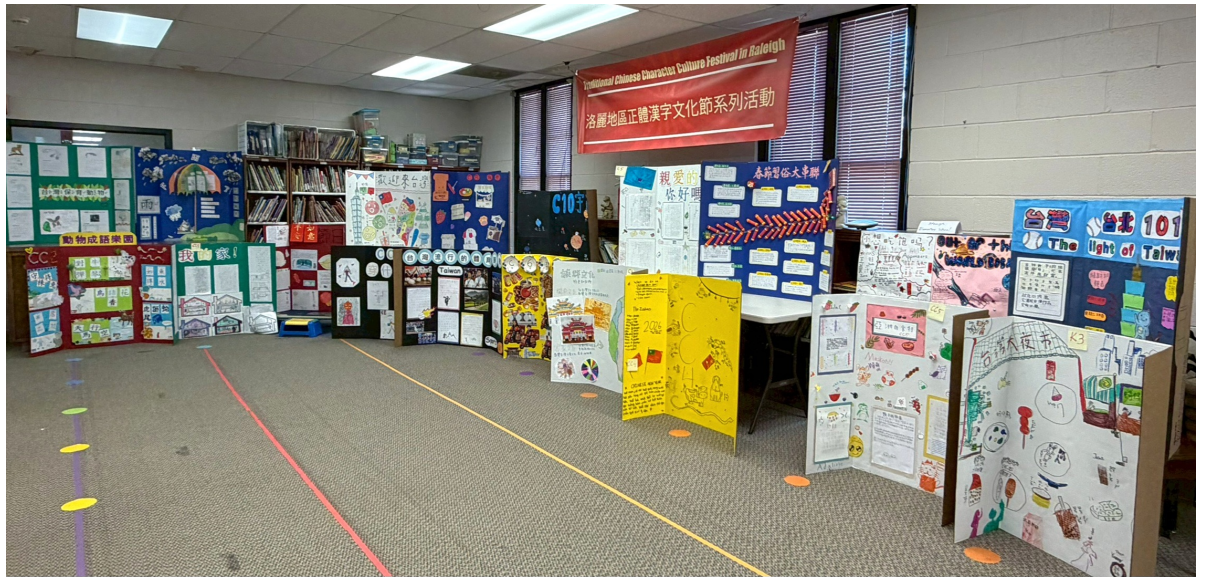
各班海報一字排開，各具特色