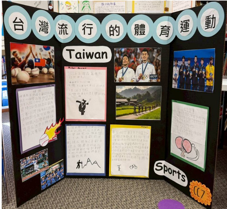
高年級組作品之一