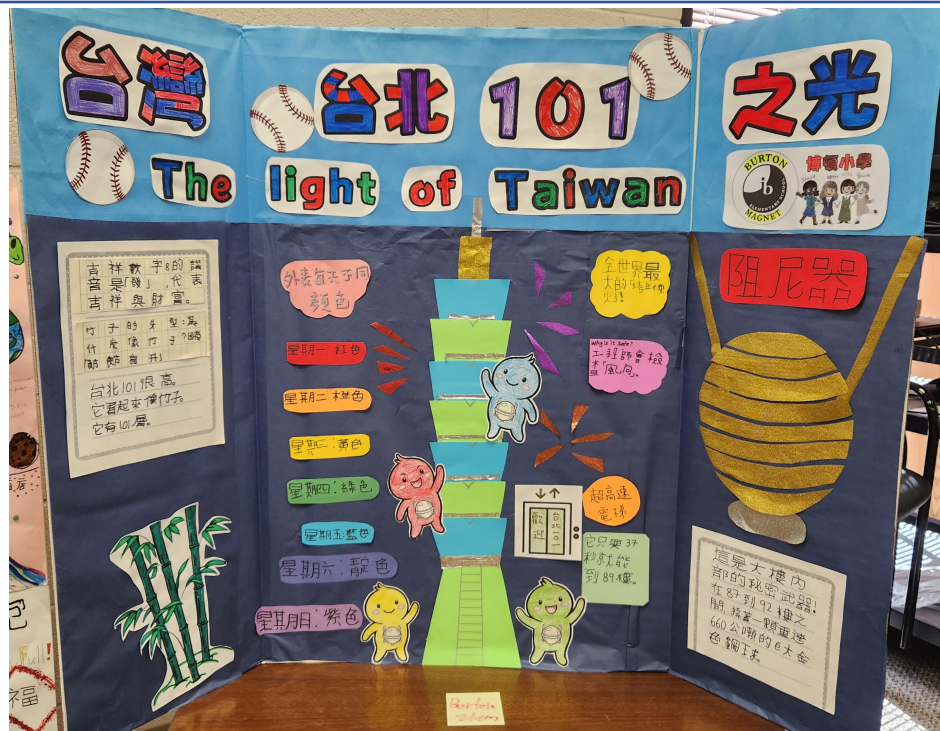
中年級組作品之一