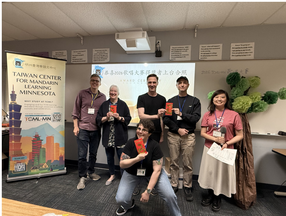
方主任和歌唱大賽團體組得獎學生合影

對TCML-MN的學生這不只是一次比賽，更是一段充滿音樂、語言與文化交流的珍貴回憶。