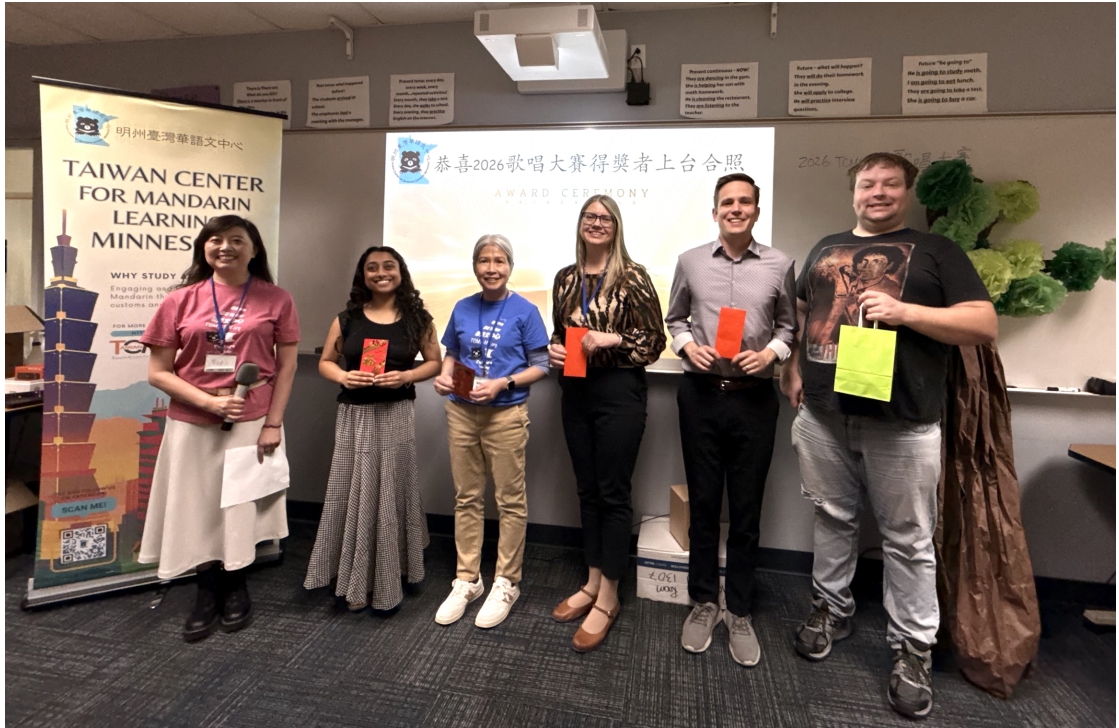
方主任和獨唱得獎學生們合影