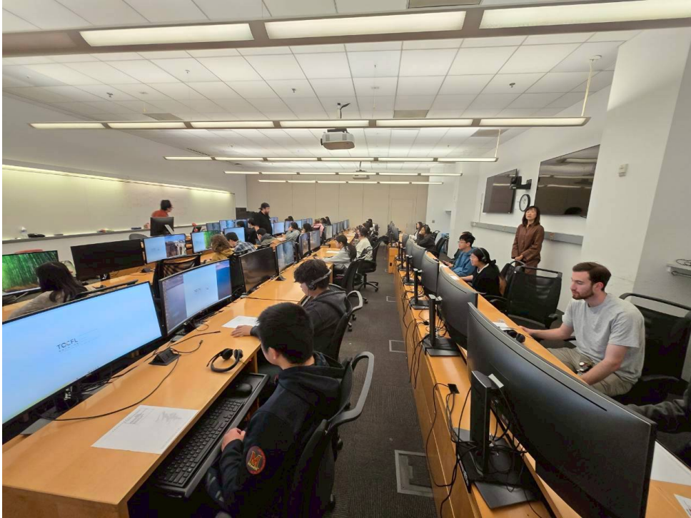
下午說寫測試考場