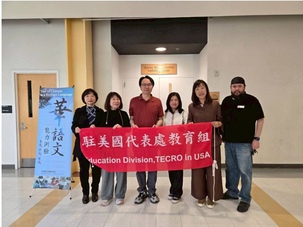
當天行政執行團隊留影