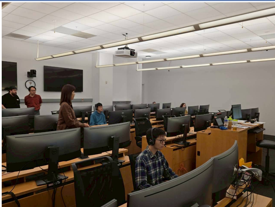
上午聽讀測試考場