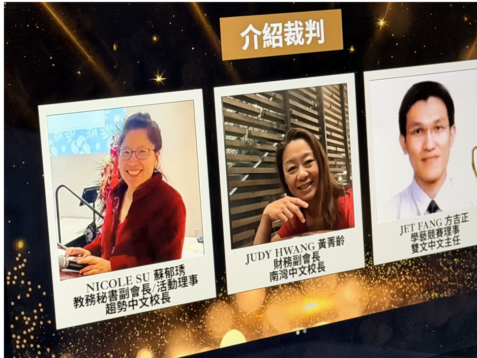
三位資深裁判講評