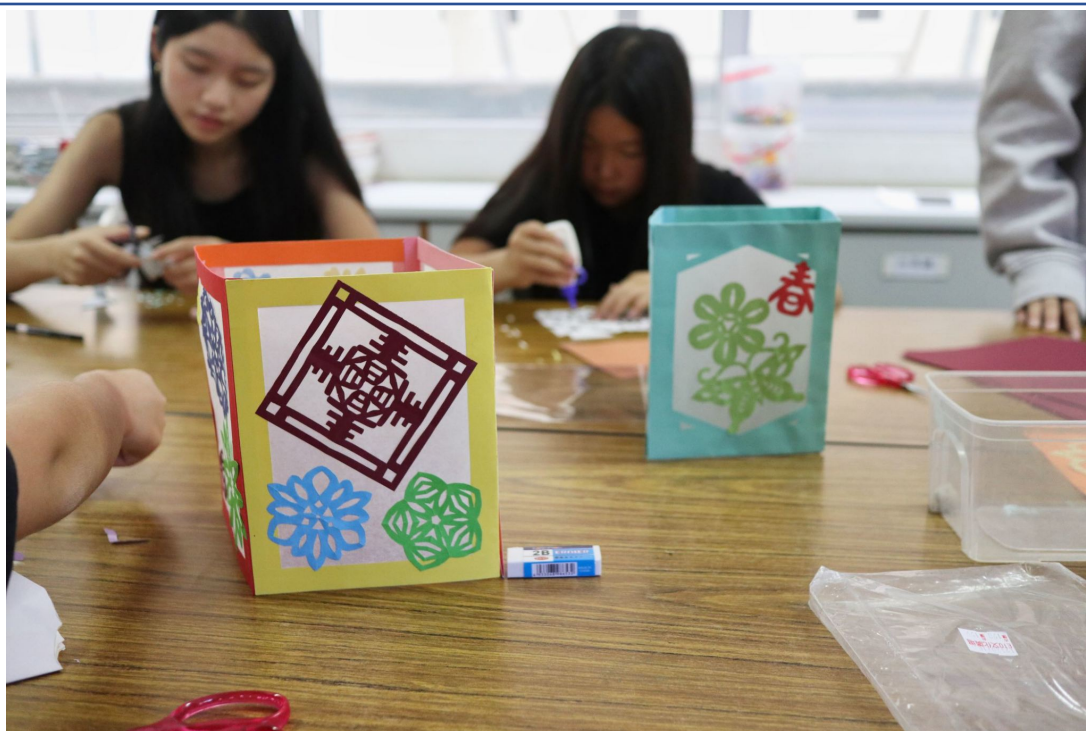
教學氣氛非常熱鬧