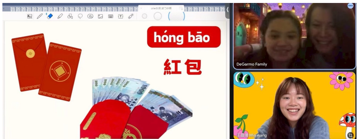
紅包具有文化符號，使活動更深入中華文化之意涵

本活動不僅展現海外僑校深耕華語教育之成果，更體現臺灣在推動正體中文及文化外交上的重要角色，為提升國際能見度與文化軟實力再添亮點。