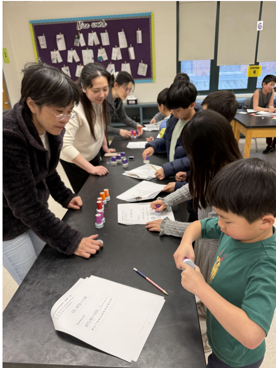
孩子們利用印章完成任務