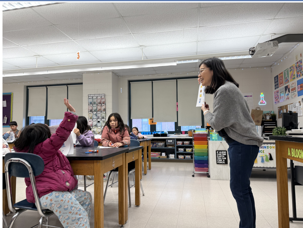
孩子們舉手發表自己的想法