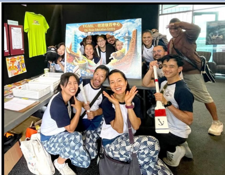
「雲太鼓」表演團隊也來打卡照相