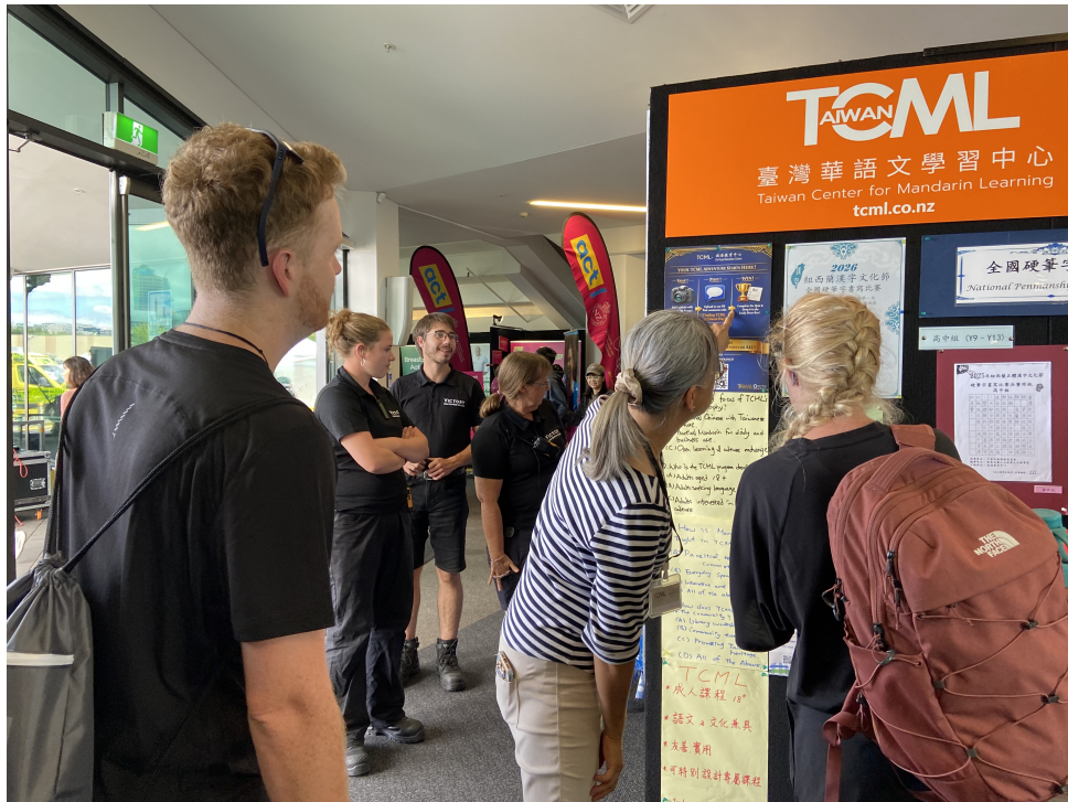
在場老師詳細講解