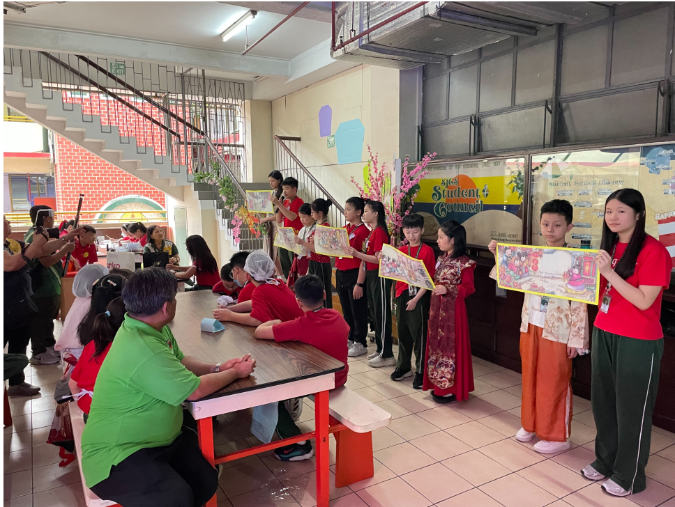
同學介紹元宵節由來