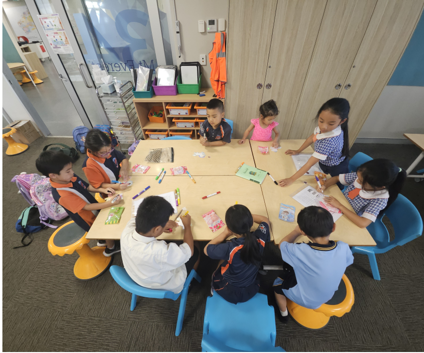
學生們在課堂上專注地彩繪小馬模型，展現創意與對華文學習的熱情。