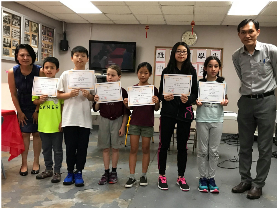
2019年紐約市學生中文書法比賽1

由展望中美國際學校主辦的第四屆「紐約市學生中文書法比賽」於6月19日(星期三)下午在曼哈頓下城靈光教堂禮堂舉行，共有來自紐約市一到八年級共50位學生參賽。比賽分成三組進行：初級組(1-2年級)、中級組(3-5年級)、高級組(6-8年級)。各組頒發前五名獎狀和獎金。此次比賽參賽學生加上隨行家屬，現場湧入超過150人。今年比賽初級組的字帖是「一寸光陰一寸金，寸金難買寸光陰」，中級組的字帖是「忠言逆耳利於行，良藥苦口利於病」，高級組的字帖是「江山代有才人出，各領風騷數百年」。學生可自行選擇書法字體。得獎學生作品獲評審和採訪媒體一致好評，遠遠超出大家對於海外學生書法水平的期望。家長紛紛表示希望這樣的比賽能夠每年舉辦，讓美國的學生有機會接觸並領略中華文化的優美和博大精深。