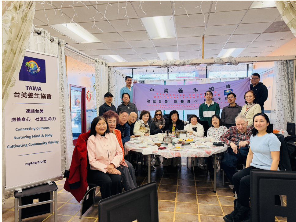
與會貴賓齊聚一堂，溫馨合影留念，場面溫馨而雅致