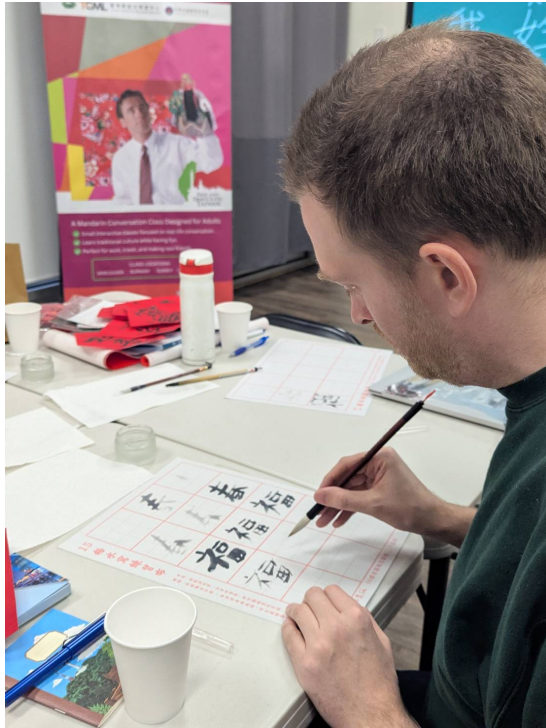
學員在水寫布上臨摹書法