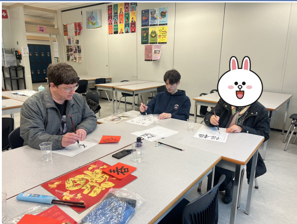
今天上課認識文房四寶，練習書法及新年用語