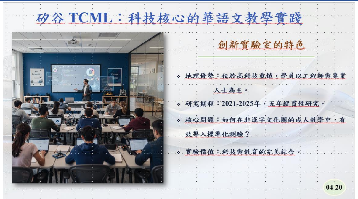
圖三：論文發表內容