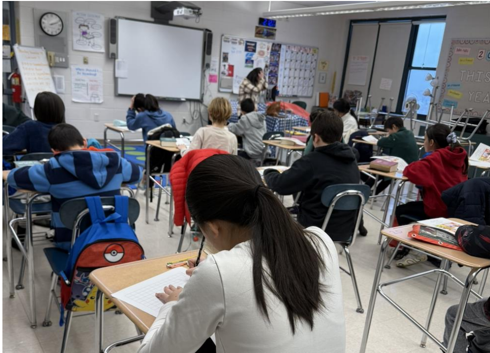
學生們個個文思泉湧、奮筆疾書。