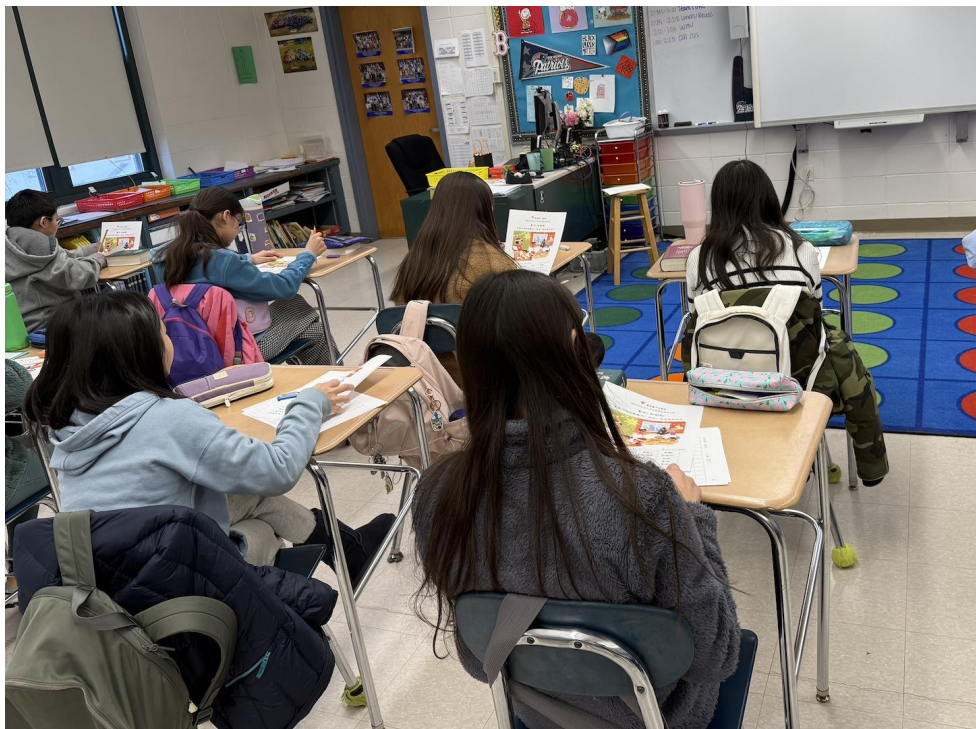
學生們仔細觀察圖片，豐富寫作的內容。

我們相信，藉由舉辦這次活動，鼓勵學生多閱讀、細心觀察，並在日常中勇於表達與互動，是累積語感、養成敘事與思辨能力的重要基礎。期盼每位同學在提筆（或打字）創作時，都能勇於思考、樂於表達，並在海外持續傳承與發揚中華文化。