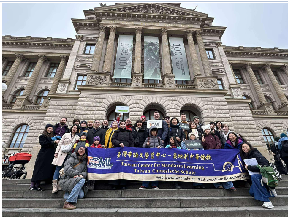
全體參與者於捷克國家博物館前合影留念