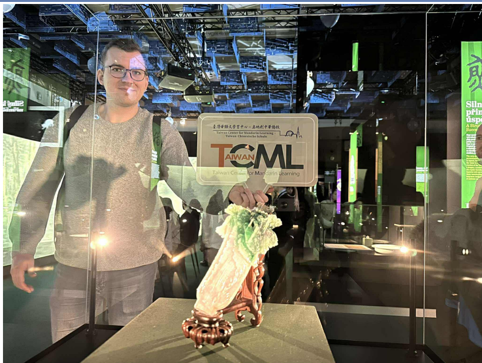
參訪活動最大亮點：翠玉白菜