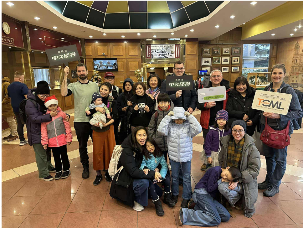
學員、親友、本地主流人士與教師行政團隊凝聚力展現