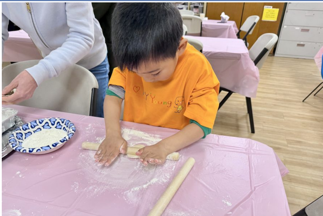
現場小朋友也在學習擀餃子皮