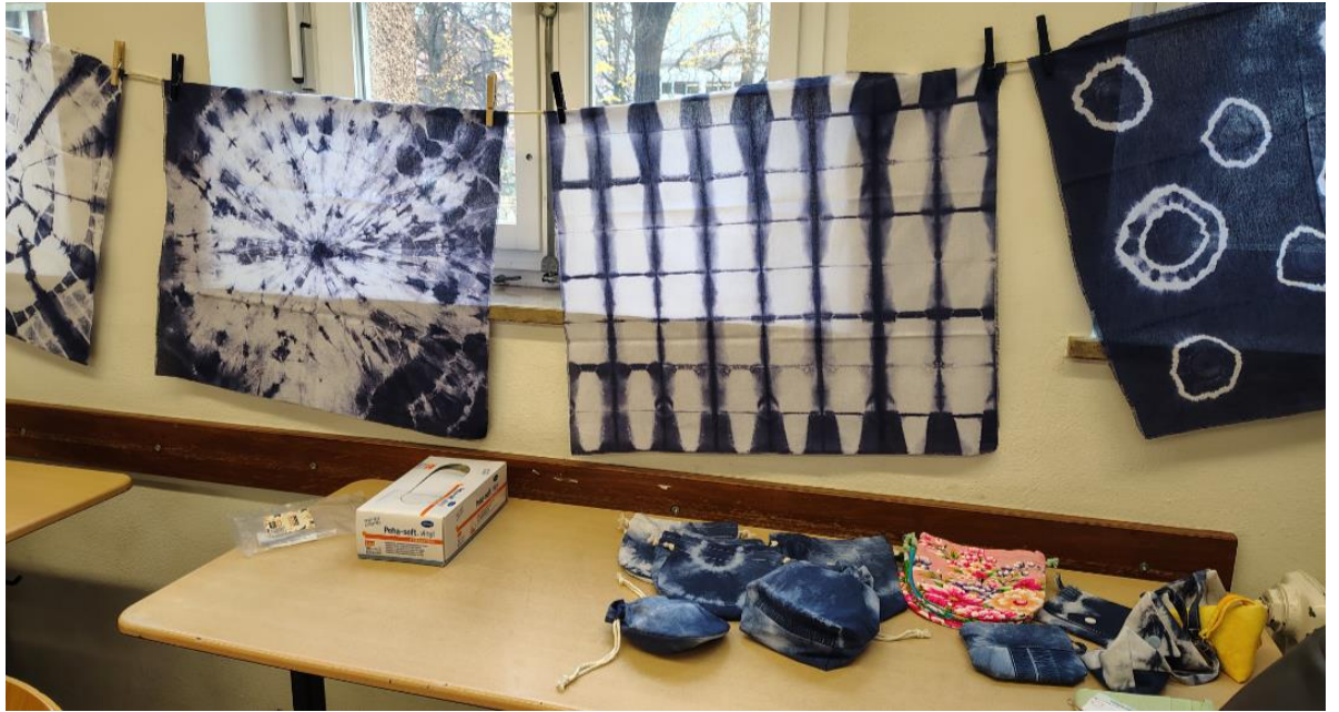
客家文化日「客家藍染手作」，一起體驗客家文化美學。