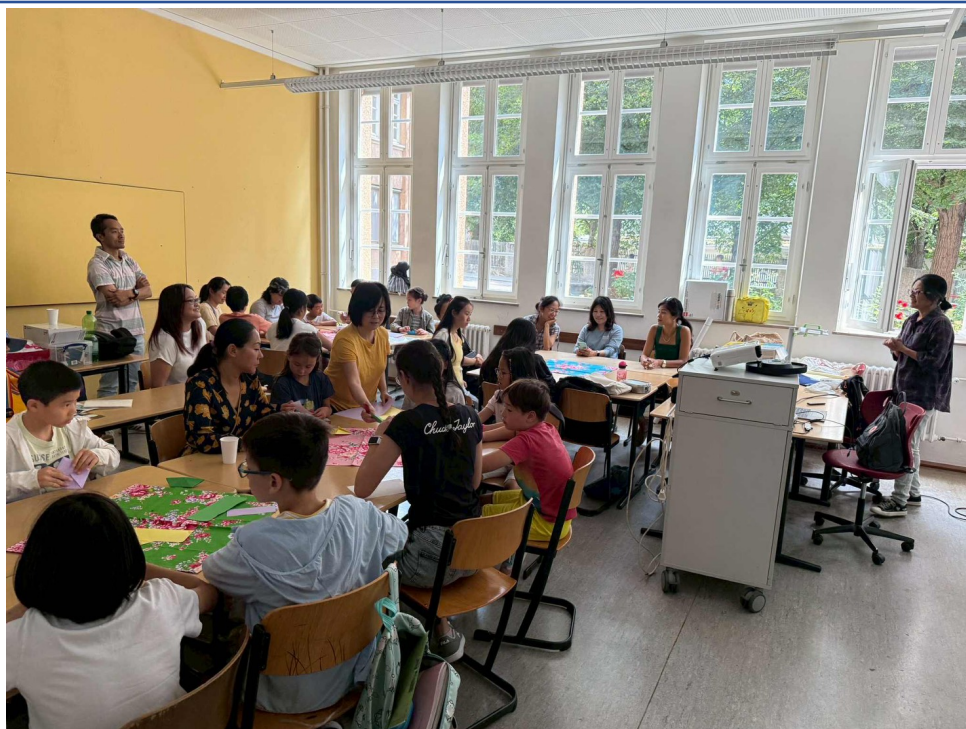
實體講座「客家概論與米食文化」，現場體驗客家麻糬的美味。