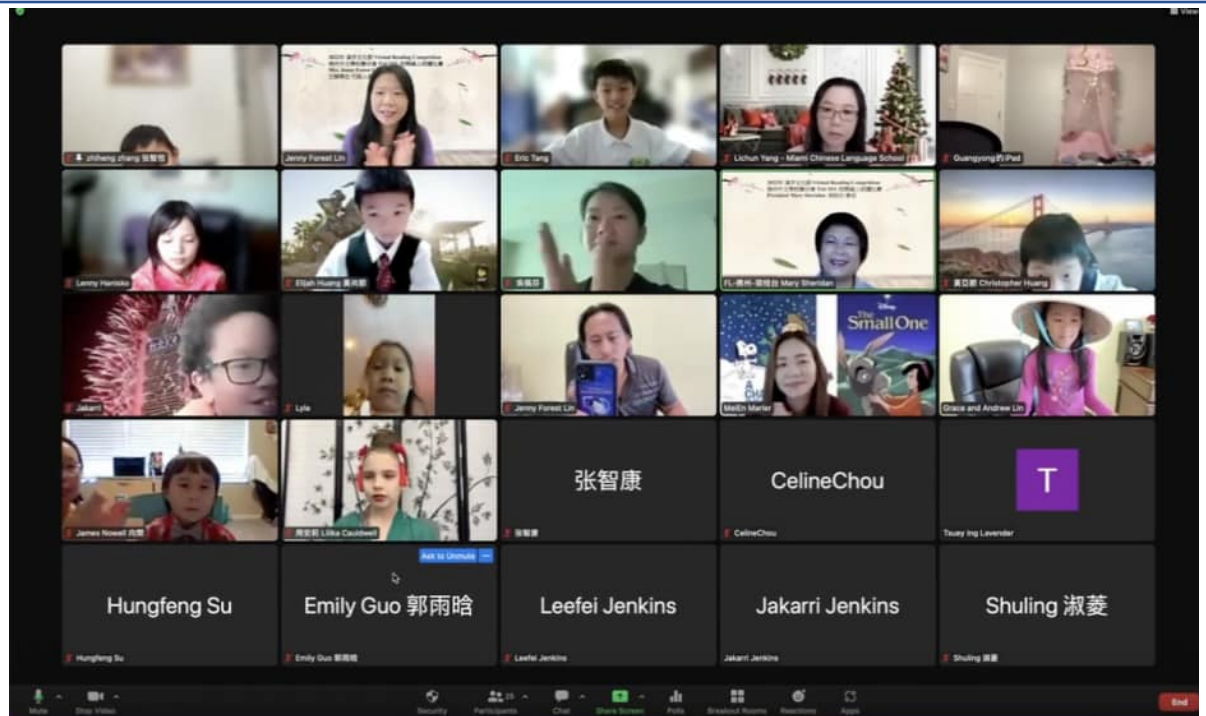
佛州中文學校聯合會 朗讀比賽大合照一