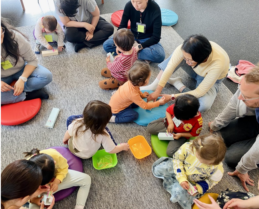
幼兒們製作自己的牙刷