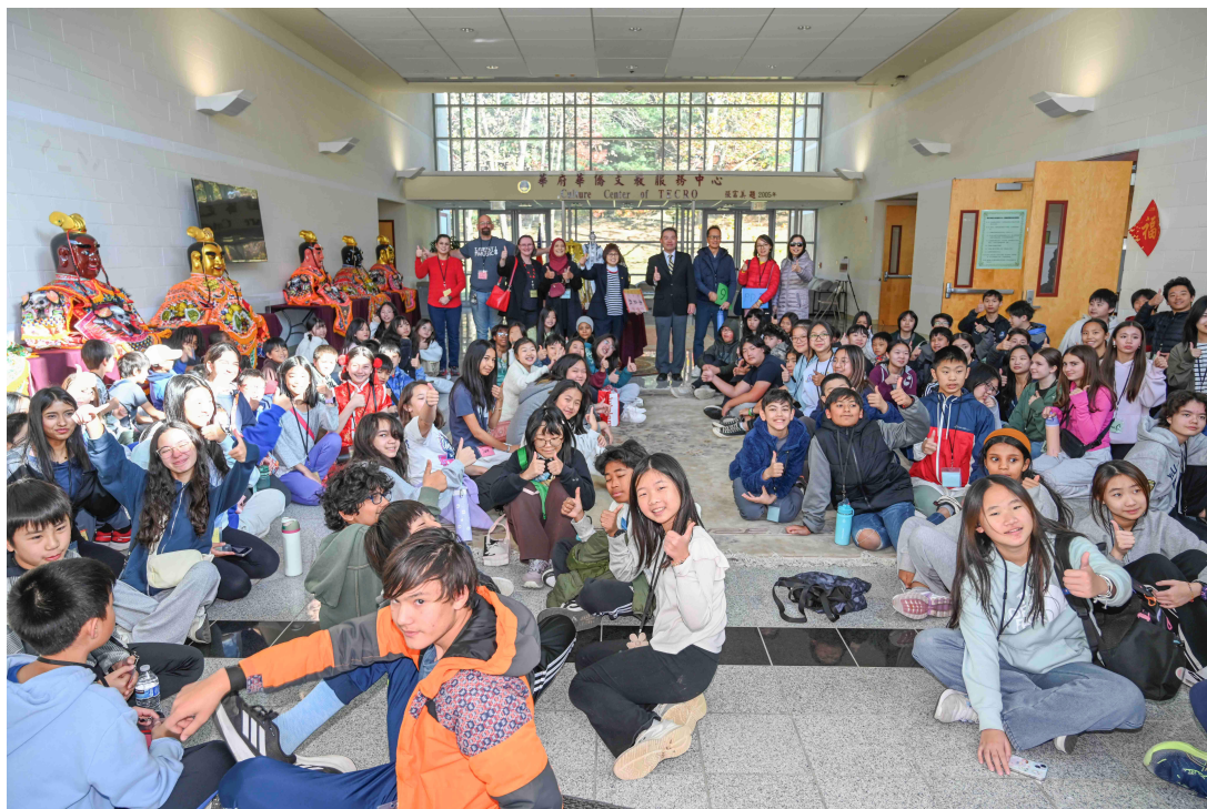
圖表1 Robert Frost Middle School 臺灣文化導覽團體照