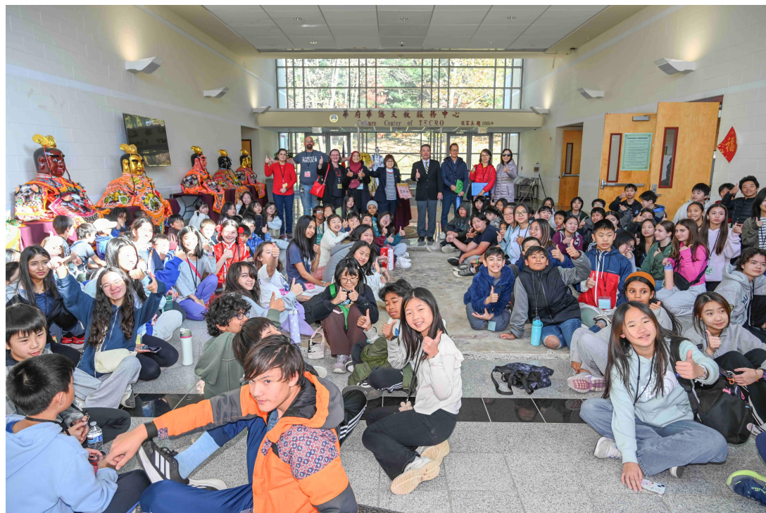
圖表1 Robert Frost Middle School 臺灣文化導覽團體照