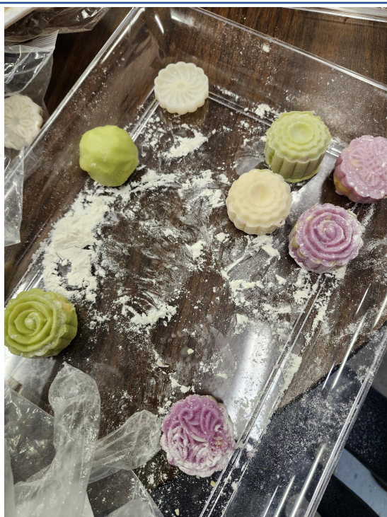
老師講解中秋節的由來