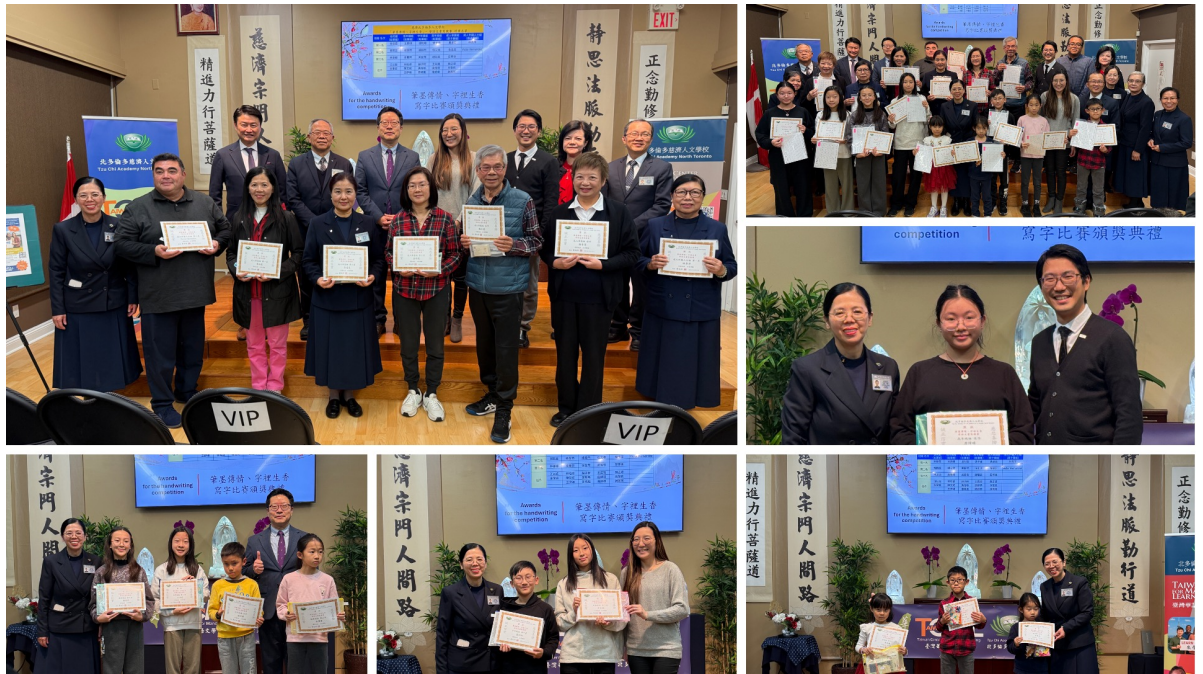
各組得獎者陸續上台領獎並與嘉賓們合影留念