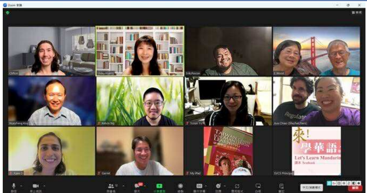
圖一：每週輔以數位線上課程