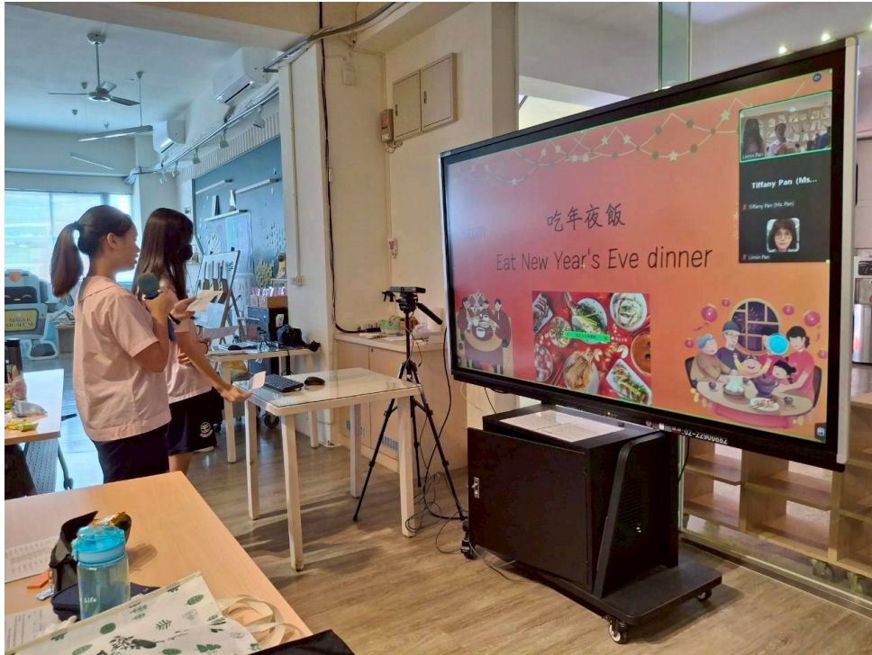
福和國中學生簡報側拍