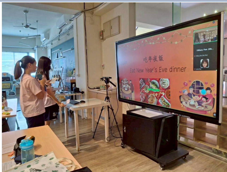
福和國中學生簡報側拍