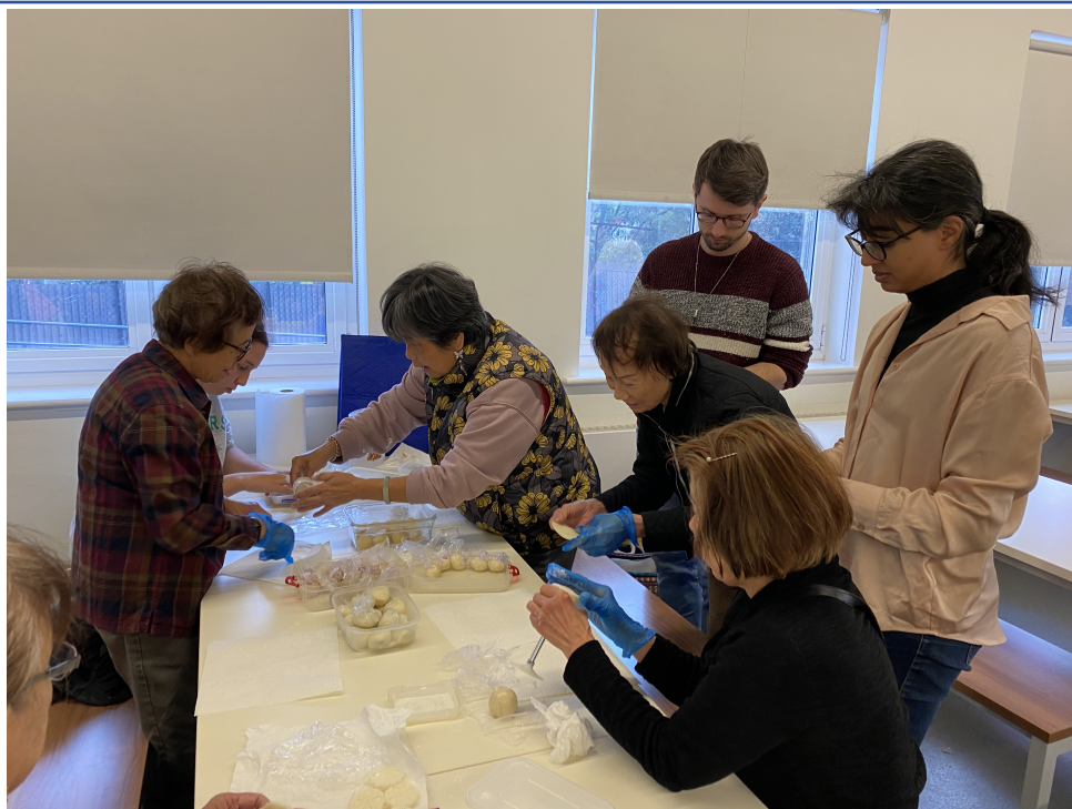
成人班學生通力合作