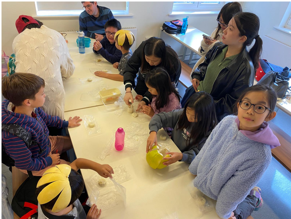
切柚子，製作柚子帽

今年中秋節前一天適逢學校上課日，因此各班老師在課堂上除了給學生們介紹中秋節的由來、節慶的意義和應景的食物等，還會加上說故事、紙燈籠手作或是學一首與中秋有關的詩來加深學生們對於這個華人傳統節日的印象。全校師生和志工則利用第二節課，齊聚學校餐廳，動手製作冰皮月餅與切柚子做柚子帽。現場不分老少和合互協，最後大家一起分享月餅和柚子，為慶祝中秋節展開了歡樂的序曲。