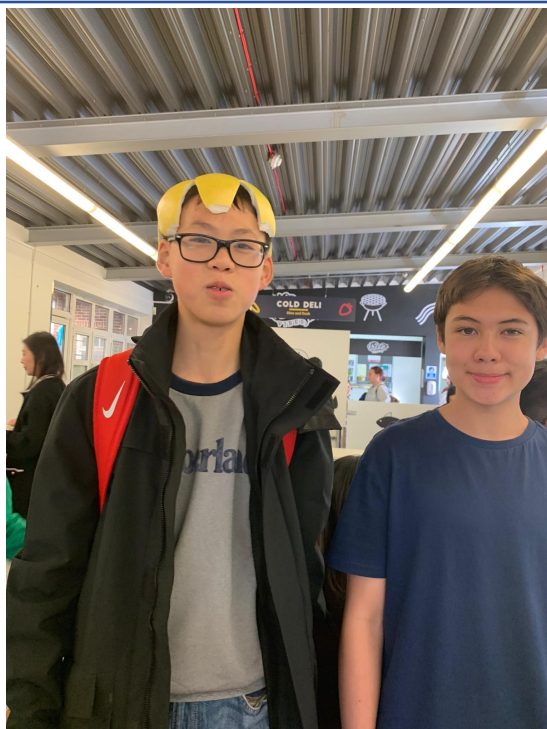
高年級學生開心戴著柚子帽