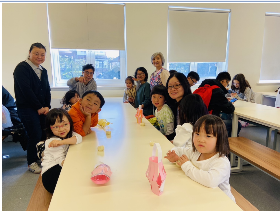
幼兒班學生有家長陪伴