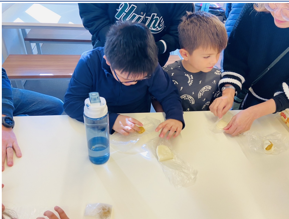
小學生聚精會神學習