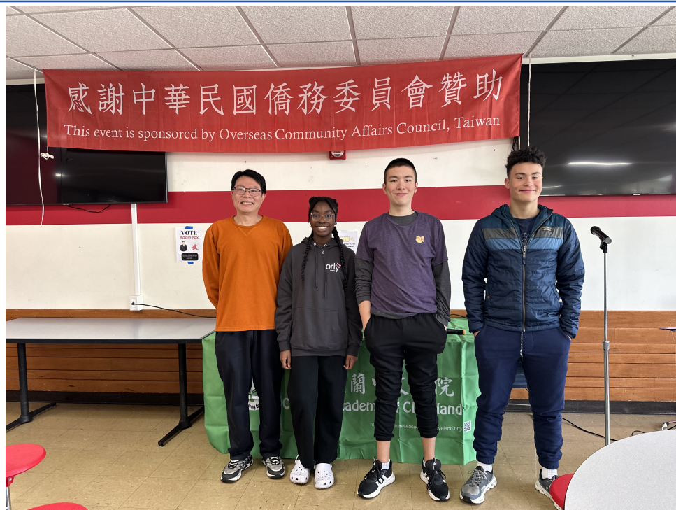
高年級生與授課老師