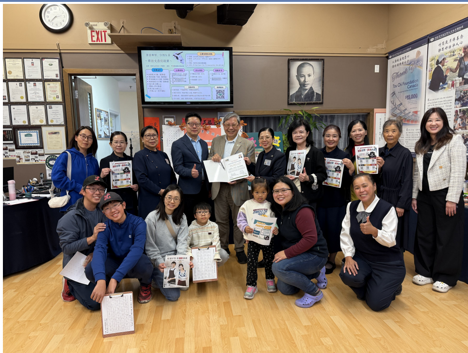
加拿大烈治文山市副市長陳志輝（Godwin Chan）頒發祝賀狀給慈濟北多倫多人文學校黃淑珍校長，與駐多倫多臺北經濟文化辦事處文化中心主任藍柏青、副主任許彩鳳及大眾一同合影留念。