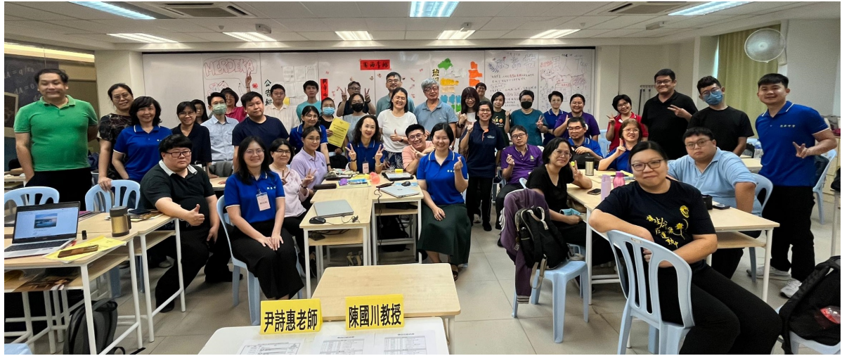
圖2：全體學員課後與講師合影留念