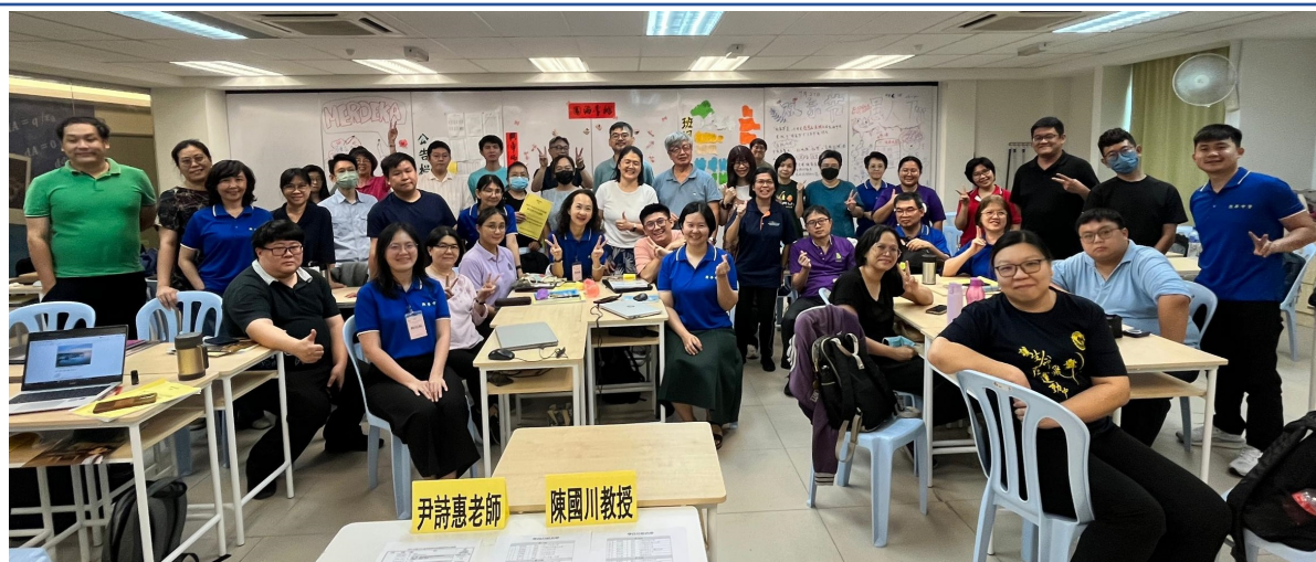
圖2：全體學員課後與講師合影留念