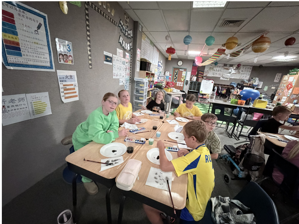
同學聚精匯神學書法國畫