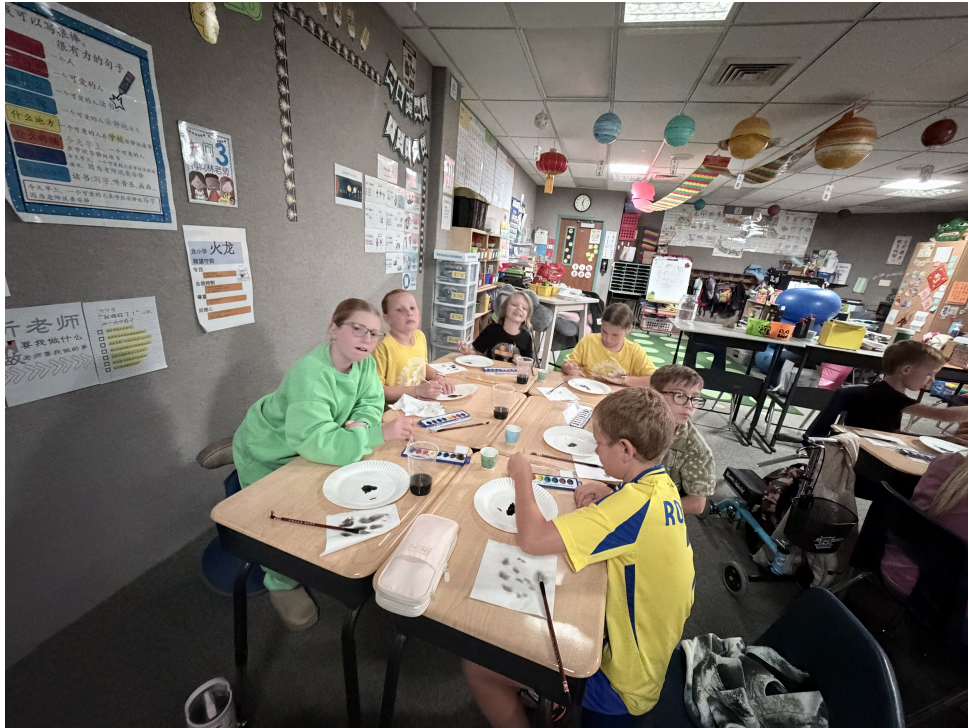
同學聚精匯神學書法國畫