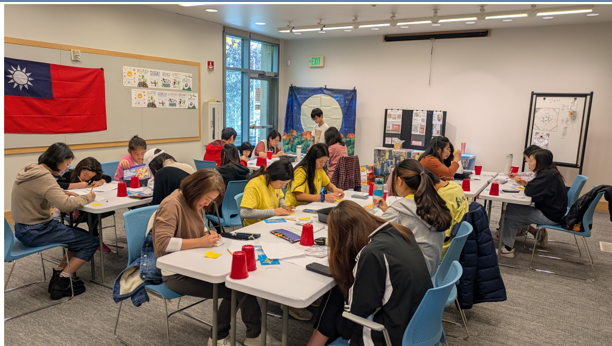
學員們實作體驗、認真彩繪。