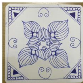
原圖設計: Zentangle禪繞畫老師 賴筱薇 (彩虹薇)