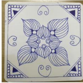
原圖設計: Zentangle禪繞畫老師 賴筱薇 (彩虹薇)