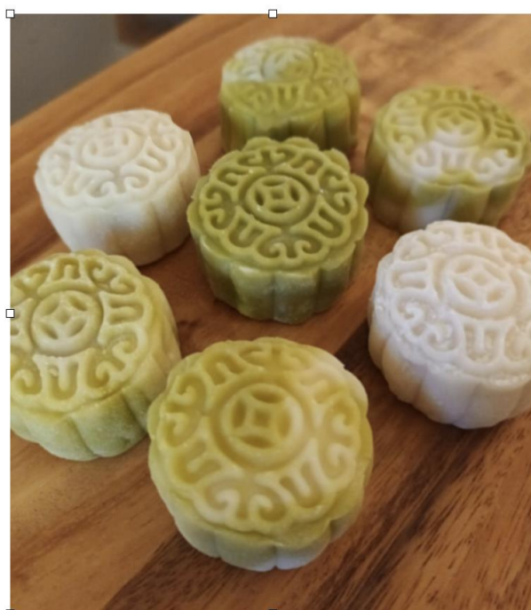
好看又好吃的冰皮月餅